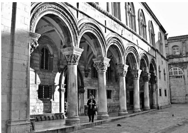
4. ábra. Dubrovnik, Rektorpalota