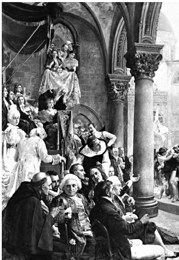
3. ábra. Vlaho Bukovac: Raguzai nő (Dubravka), 1894. Budapest, Szépművészeti Múzeum, olaj, vászon, 300×220 cm

lyet a híres raguzai költő, Ivan Gundulić pásztorjátékától kölcsönzött. A festmény jobb oldalán az a jelenet látható a darabból, amelyen a városállamot megszemélyesítő pásztorlány és a külső ellenséget szimbolizáló szatír küzd egymással. A nagyméretű, sokalakos kompozíció bal oldalán a Rektorpalota loggiája szerepel, amelyet – mintegy a színdarab közönségeként – Raguza különböző századokban élt tudósai és művészei népesítenek be. A kiválóságok között szerepel többek között a színjáték szerzője, Gundulić és díszpáholyának háttal támaszkodva Giorgio Baglivi, raguzai származású anatómus és fiziológus, aki a római egyetemen tanítva számos orvostudományi könyvvvel szerzett nevet magának. Aszklépiosz az utolsó arkádívet tartó féloszlop fejezetén tűnik fel. Pietro da Milano (működött 1431 és 1473 között) szemléletes domborművéről készült közeli felvételen jól kivehető a felirattal is jelölt szakállas Aszklépiosz, aki orvosi laboratóriumában ülve két ajándékot hozó férfit fogad. A Raguzai Köztársaság vezetőinek székhelyéül szolgáló palota oszlopfőjére feltehetően azért került Aszk-