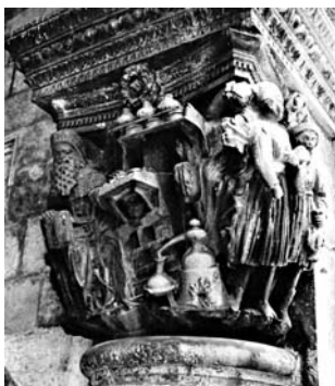
5. ábra. Pietro da Milano: Aszklépiosz, XIV. század negyvenes évei. A dubrovnikai Rektor-palota faragott oszlopfője

lépiosz, mert a ragály által gyakran sújtott város ily módon remélt segítséget a pusztító járványokkal szemben, de utalhat a város lakóinak epidaurusi származására is.