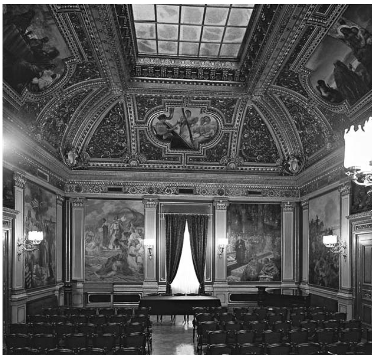
1. ábra. Arany Terem, Zágráb

E rövid kitérő után nézzük meg kö- zelebbről a Budapesten lévő két horvát festményt. A római és firenzei festészeti előtanulmányok után 1888 és 1893 kö- zött a Münchener Akadémián Wágner Sándor professzor osztályába járó Ce- lestin Medovič a Négy szerémi vértanú a bírótság előtt című képének témájául a Di-