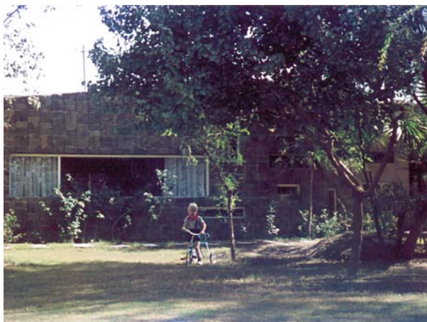
A bagdadi ház, amelyben laktunk

A FAO-szakértőknek nem az volt az elsőrendű teendőjük, hogy teljesítsék a szakmai fel-