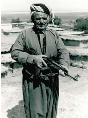
Vendéglátó kurd házigazdánk hétköznapi viseletben

mertem, otthon pedig nem várt rám olyan szakmai feladat, ami halaszthatatlanná tette volna hazatérésemet. Egy iráni újabb 3 évvel együtt 5 és fél év lett volna a FAO-nál eltöltött szolgálati időm, márpedig 5 év szolgálati idő elegendő volt a FAO-nyugdíjjogosultság megszerzéséhez. És a rangos projektigazgatói fizetés is nyomós