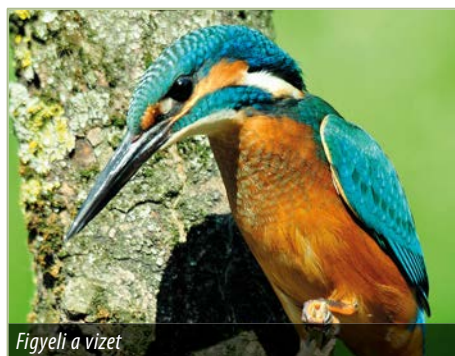
Figyeli a vizet