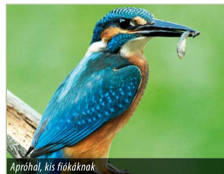
Apróhal, kis fiókáknak