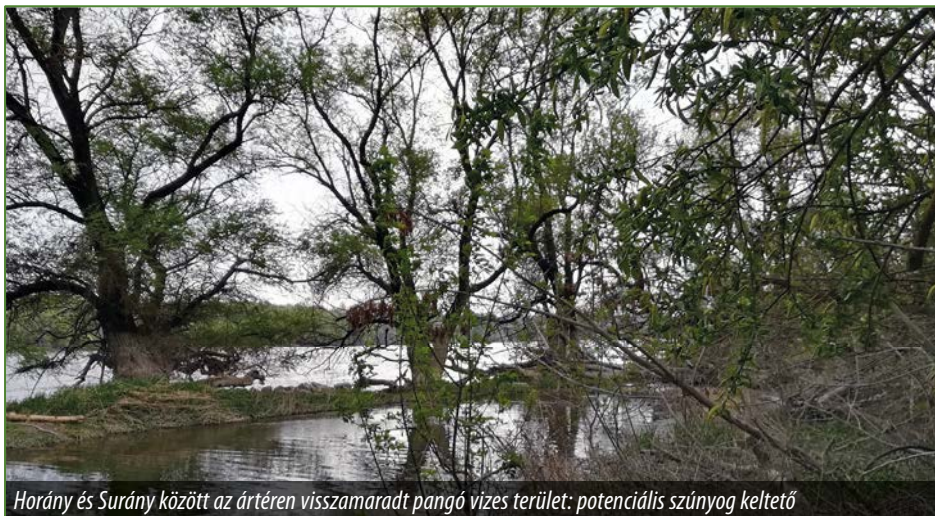
Horány és Surány között az ártéren visszamaradt pangó vizes terület: potenciális szúnyog keltető

A kémiai gyérítést a szakemberek szintetikus piretrin származékokkal végzik. Nem szelektív hatású szer, tehát más rovarokat is pusztít pl. méheket (egy MTA tanulmány szerint az elhullott rovarok ~0.1%-a volt csípőszúnyog [4], sőt ezen felül halakra és kételtűekre is veszélyes. További tudományos adatok támasztják alá, hogy túlnyomórészt piretroid-alapú gyérítés időzítése,