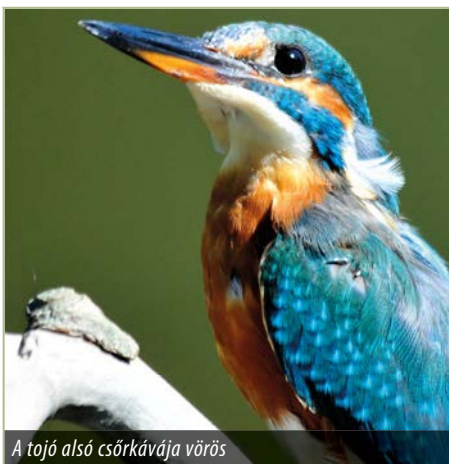
A tojó alsó csőrakávája vörös