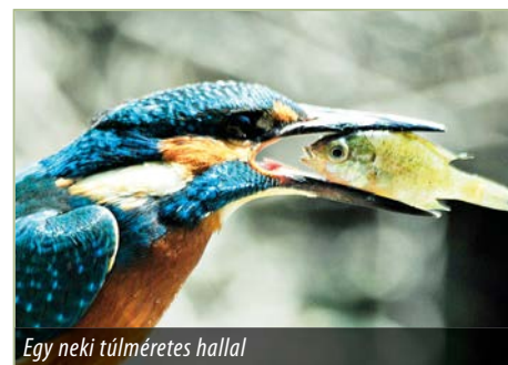
Egy neki túlméretes hallal