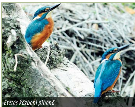
Etetés közbeni pihenő