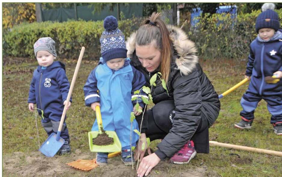
Az ültetésből a legkisebbek is kivették a részüket