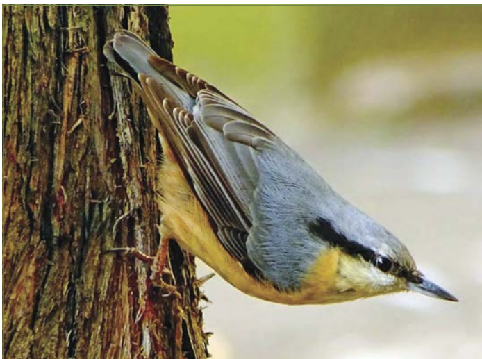
Csuszka fejjel lefele