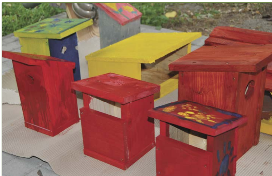
Az elkészült odúk egy része