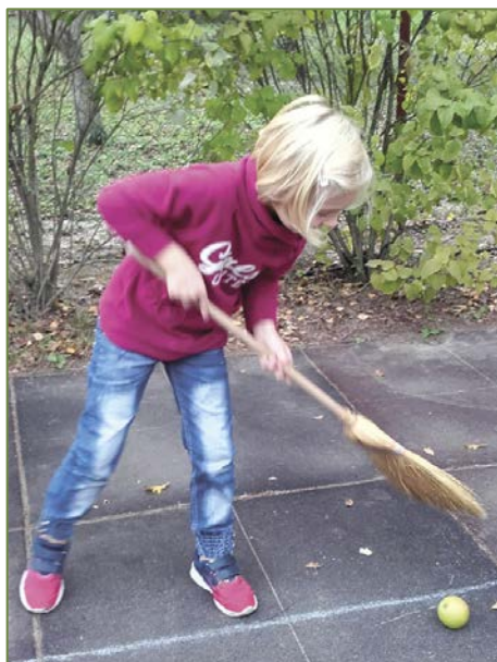
Az alma-szlalom nem könnyű, de nekem sikerült!