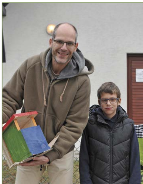
A boldog odútulajdonosok