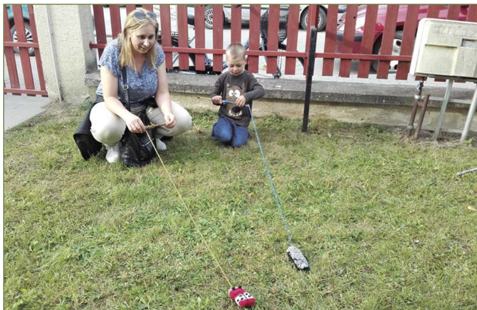
Hajrá katica, hajrá kis kukac!