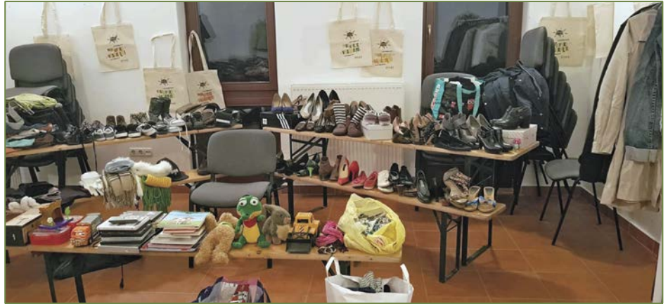
Az ültetésből a legkisebbek is kivették a részüket