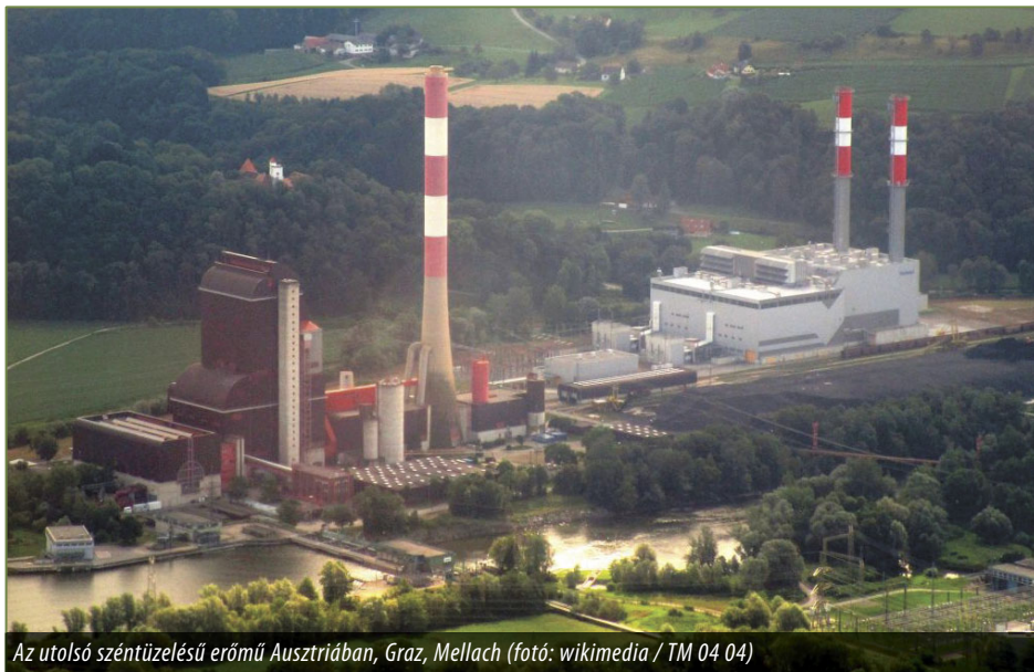
Az utolsó széntüzelésű erőmű Ausztriában, Graz, Mellach

Kilenc éve nem tapasztalt mértékben apadt le az ibolyántúli sugárzástól védő ózonréteg április elején az északi sarkkör fölött. A magas légköri – 18 kilométeres magasságban – lebegő ózonmolekulák szezonális ingadozásával ez nem magyarázható, az Antarktisszal szemben az északi