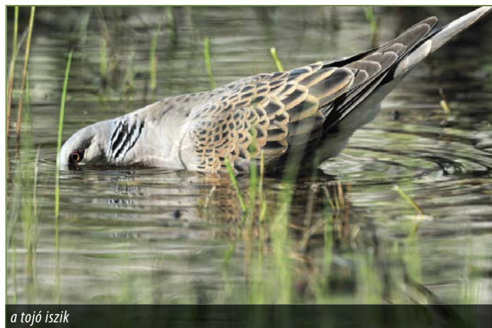
a tojó iszik