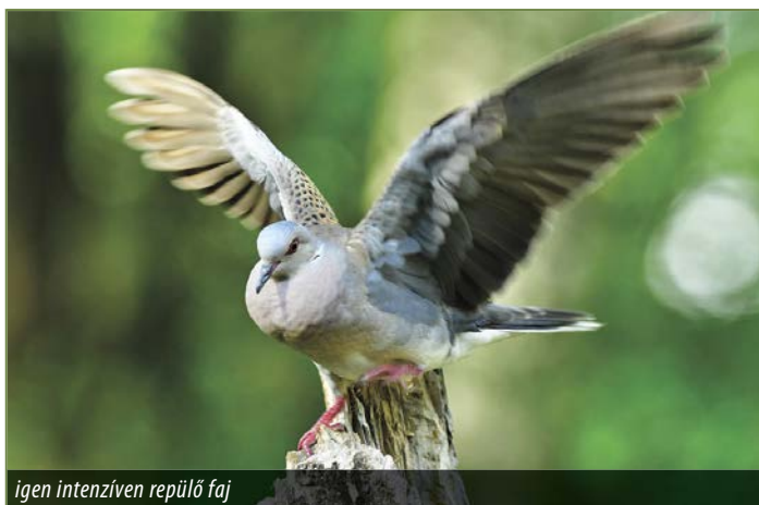
igen intenzíven repülő faj