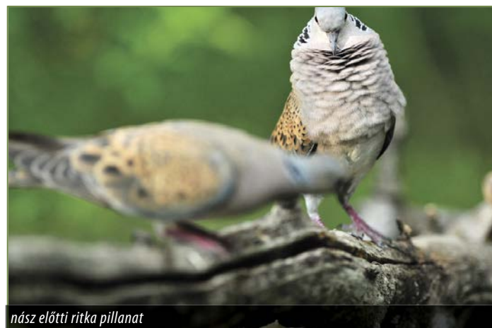
nász előtti ritka pillanat