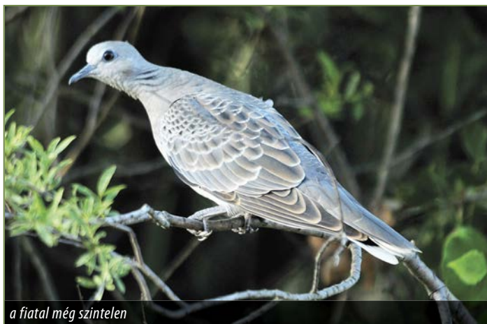
a fiatal még szintelen