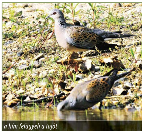
a hím felügyeli a tojót

A vadgerlek május elején érkeznek Magyarországra, és a szigetre is, amikor felhangzik a jellegzetes turbékolásuk. Ősszel déli irányba vonulnak, és a telet Afrikában töltik. Élőhelyei itt a szigetet körülvevő ártéri erdők, a falu lombosabb kertjei, és a még fellelhető erdők szélei, ligetei. Megérkezés után a párválasztás és fészekrakás az első dolguk. Fészük a többi galambhoz hasonlóan vékony kis száraz ágacskákból áll, melyet a tojó helyez nagy gondossággal egymásra, de azért a fészek a