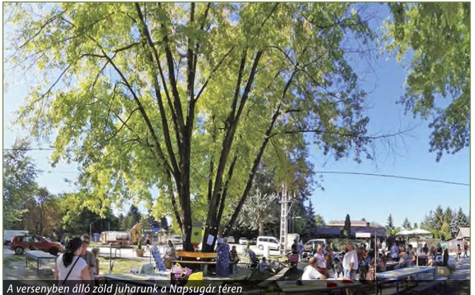
A versenyben álló zöld juharunk a Napsugár téren