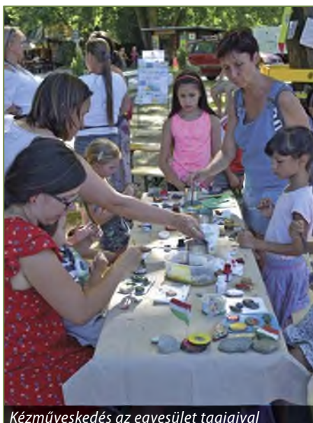
Kézműveskedés az egyesület tagjaival