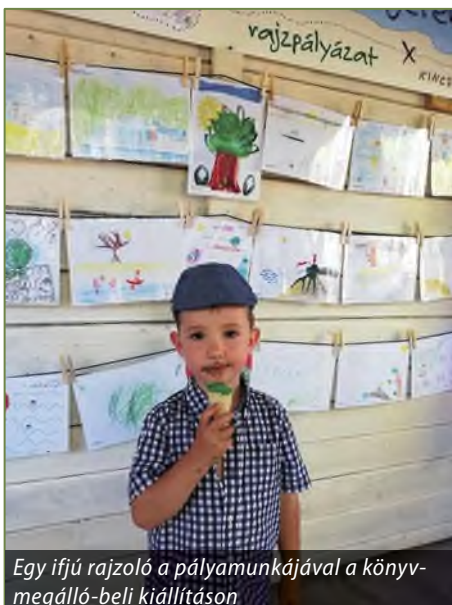
Egy ifjú rajzoló a pályamunkájával a könyvmegálló-beli kiállításon