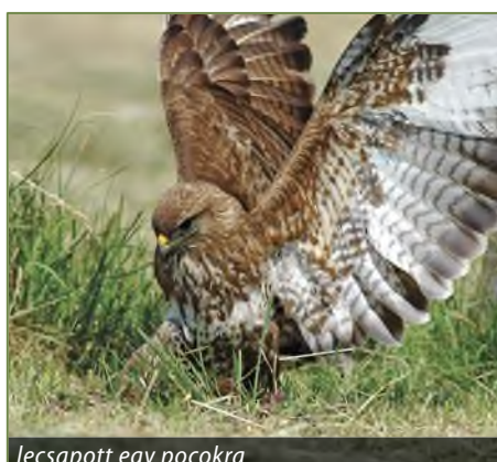
lecsapott egy pocokra