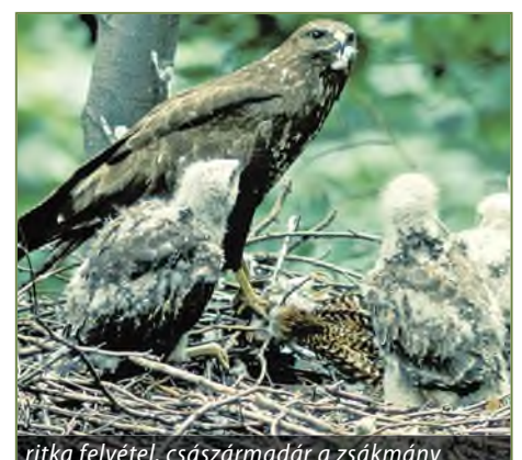
ritka felvétel, császármadár a zsákmány