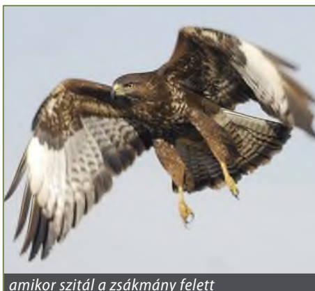
amikor szitál a zsákmány felett