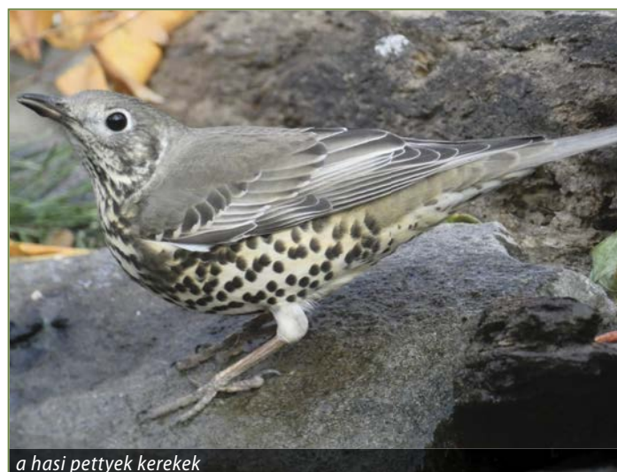
a hasi pettyek kerek