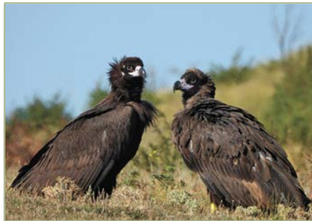
SZÍNES GYŰRŰVEL JELÖLT BOLGÁR BARÁTKESELYŰK