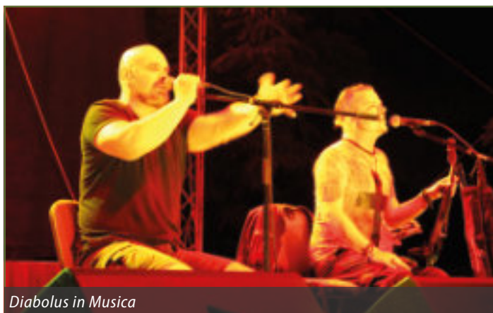
Diabolus in Musica