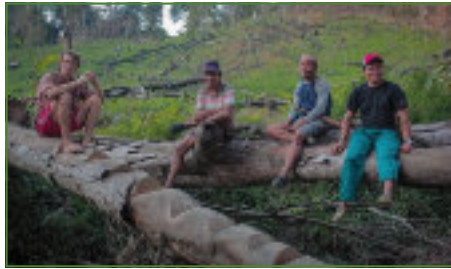
Angus a film három főszereplőjével.

A fenntartható erdőgazdálkodás minősítési rendszerét a fakitermelő szektor dominálja. A minősítést magáncégek végzik, amelyek abban érdekeltek, hogy minél