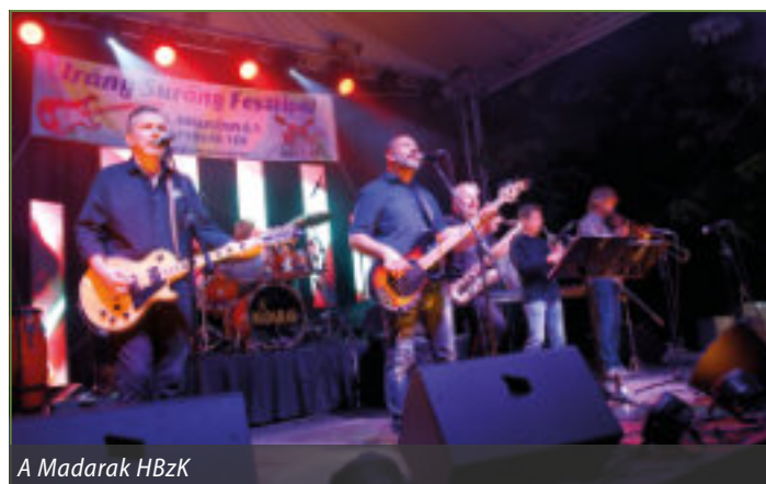
A Madarak HBzK