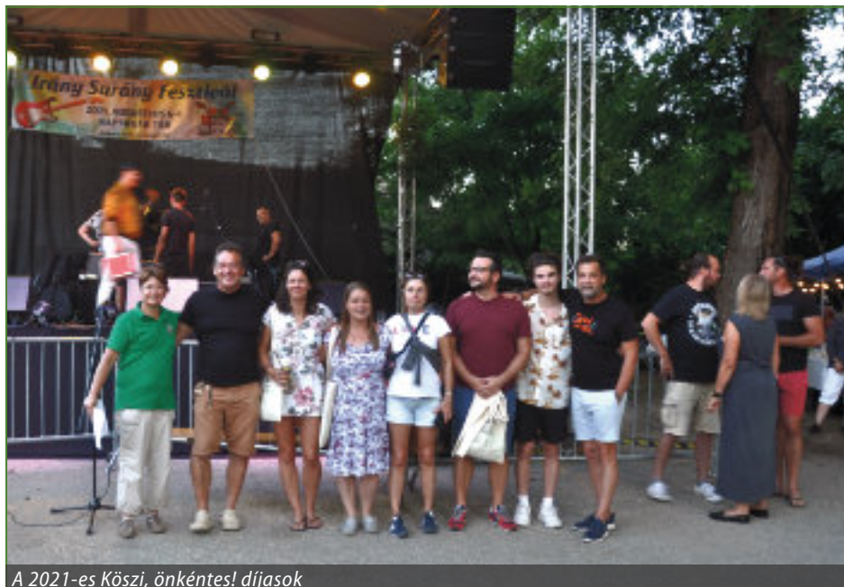
A 2021-es Köszí, önkéntes! díjasok

Volt tavaly egy surányi lakos, aki fejébe vette, hogy a Napsugár téri juharfánkat benevezi az Év fája versenybe. Így is lett, és a hosszú kampányidőszakot nagyon ügyesen menedzselte. Mindenkit és minden online cso-