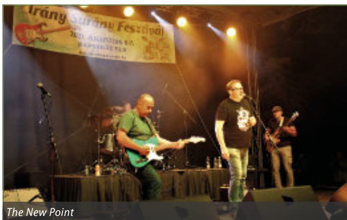
The New Point