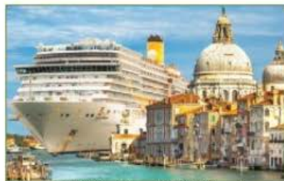
Óriás tengerjáró Velencében a kikötési tilalom előtt

mértékét, hogy a hajókat kötelezik az elektromos áram vételezésére, ahelyett hogy a saját dízelgenerátorokat használnák. Támogathatják továbbá a zéró kibocsátású üzemanyagok bevezetését” – mondta a TCE kampányfelelőse. 2019-hez képest a tengerjáró hajók száma, a kikötőkben eltöltött idő és általuk fogyasztott üzemanyag egyaránt közel a negyedével nőtt. A kén-oxidok kibocsátása pedig 9, a nitrogén-oxidoké 18, a kisméretű szilárd részecskék (döntően korom) emissziója pedig 25%-kal nőtt. Tavaly az Európa legszennyezettebb kikötője címet Barcelona vitte el, a nem dicsőséges rangsorban a Rómától északnyugatra fekvő Civitavecchia követte, a harmadik pedig az athéni Pireusz volt. Barcelonában a tengerjáró hajók csaknem háromszor több kén-oxidot bocsátottak ki, mint a város összes autója. Az autókra vonatkozó uniós határértékek százszerosa van megengedve a nagy hajóknak, amelyek egy ezrelék kén tartalmú üzemanyagot használhatnak, szemben a benzinkutaknál kinalható 0,01 ezreléssel. Számos „álmohajós” üzemeltető, például a legszennyezőbb flottával rendelkező MSC Cruises, tisztább alternatívaként cseppfolyós földgázra (LNG) áll át. Az idén eddig megrendelt tengerjárók több mint 40%-a LNG-vel működik majd. Ezek a hajók kevesebb kén bocsátanak ki, viszont éghajlati szempontból káros a hajótüvegvíz szivárgó metán. Ennek üvegházhatása több mint 80-szorosa a szén-dioxidénak.