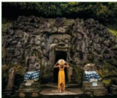
Hindu templom Ubud közelében

A 2020-21-es nagy visszaesés után a Covid-vakcinák hatásosságának köszönhetően újra útnak indultak a turisták. A vendéglátóhelyek, az utazási irodák és a légi társaságok számára örömteli a megnövekedett bevétel, a helyi lakosokat az árnyoldalak zavarják: a növekvő szemétnemesség, a magasabb zajszint, a környezetrombolás. Egyes helyszíneken a vendégszám csökkentésével próbálkoznak, igencsak felemás módon. A 373 ezer lélekszámú Izlandra például évente már 1,7 millióan látogatnak. Félidig nem kellett idegenforgalmi adót fizetni, de, egyelőre – a miniszterelnök megnyugtatónak szánt szavai szerint – „kezdetben nem magas” értékben be fogják vezetni. A bevételt az infrastruktúra és a szolgáltatások, a közlekedési hálózatok javítására, a fenntarthatósági kezdeményezések támogatására és a túlzásfoltosság okozta károk visszafordítására fordítják majd.