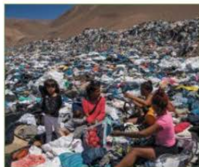
Kislányok hordható ruhadarabokat keresnek az Atacama sivatagban

Chile már régóta gyűjtőhelye a használt és az eladatlan ruháknak, melyeket elsősorban Kínában vagy Bangladesben állítanak elő; Európában, Ázsiában vagy az Egyesült Államokban árulnak, végül pedig Chilében deponálnak. Az országba körülbelül 59 ezer tonnányi csele ruha érkezik évente. Ennek egy részét felvásárolják a chilei kereskedők, a maradék mintegy 39 ezer tona pedig illegálisan az Atacama sivatagi személerakókban köt ki. Ez a Föld egyik legszárazabb sivatagja, és terepviszonyai olyannyira hasonlítanak a Marsra, hogy a NASA ott tesztelte járműveit.