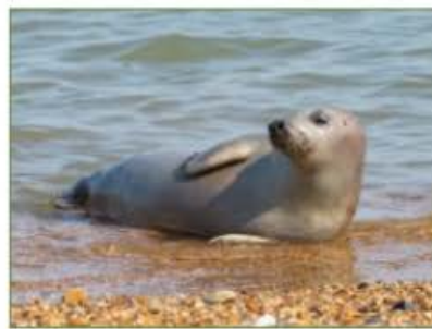
Száz év után újra: fókák az oostendei strandon

vagy Lyon között –, de az intézkedés alól több kivétel is van és a magángépekre sem vonatkozik.) Más sportágakban egyébként már korábban bevezettek hasonló intézkedéseket. A probléma több mint jelképes, a másfél hónapon át tartó október-novemberi indiai krikett világbajnokságon a férficsapatok nyolc helyszín között röpködtek. A magángépekre is érdemes lenne több figyelmet szentelni, Steven Spielberg repülője például nyáron két hónap alatt 117 ezer eurónyi (44 millió forintot érő) üzemanyagot pöfögött a légkörbe.