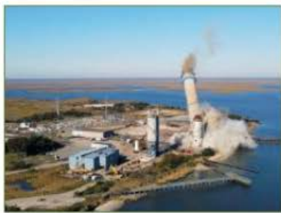
Robbantásvető változás a New Jersey-i félszigeten

Bőven van miért aggódnunk azoknak, akiket kicsit is érdekel, mennyire marad élhető az emberiséget körülvevő világ, milyenek lesznek az éghajlati, a természeti körülmények. A környezeti katasztrófákról szóló számtalan hír hajlamosít az elkeseredésre, netán apátiára. Az év végéhez közeledve próbálkozzunk a remény felélesztésére alkalmas úgynevezett jó hírekkel – írja az Euronews zöld hírekkel foglalkozó melléklete. Kiragadunk néhány apró példát.