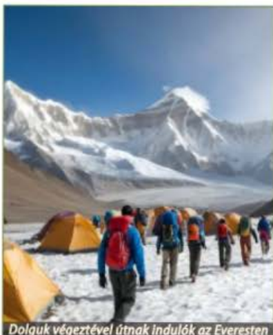
Doljuk végeztével útnak indulók az Everesten

„A hegyeink elkezdtek bűzleni” – nyilatkozott a BBC-nek Mingma Sherpa, a régió önkormányzatának az elnöke. „Panaszkodnak, hogy emberi széklet látható a sziklákon, néhány hegymászó pedig meg is betegedett. Ez elfogadhatatlan, és rontja az imázsunkat” – mondta Mingma.