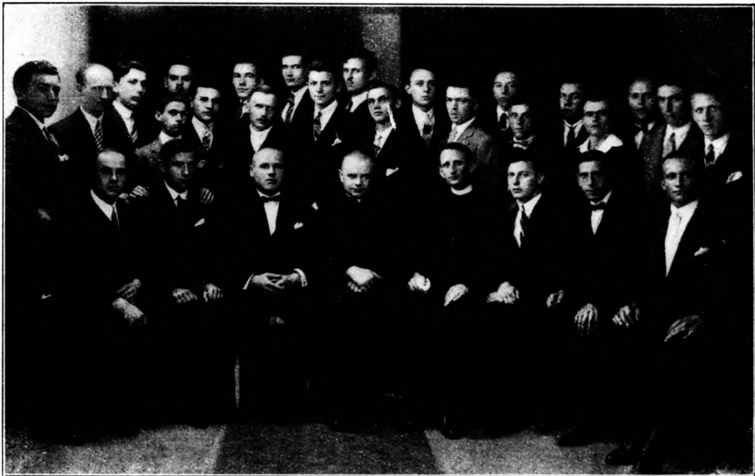
Clarisseum Don Bosco Köre.

A szülőknek és a nevelőknek már a természettől beléjük oltott s a hivatásban való buzgólkodás által kifejlesztett képességük a kegyelem munkájától támogatva megszerezheti számukra azt a biztos élelátást, amely képesíti őket arra, hogy kiis-