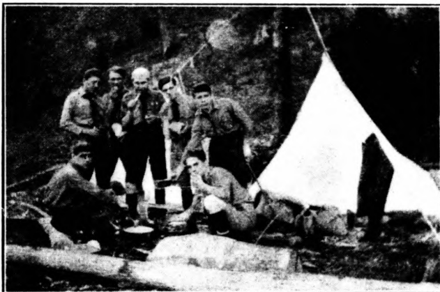
A 913. sz. „Don Bosco” cserkészcsapat táborozása.

Júl. 8-10. Szivgárdánk résztvett a Szivhéten. Nyolcadikán reggel mejelent a pápai Nuncius úr fogadására s a Kongregációs Ötthonban tartott szentmisén több gárdista megáldozott. A megnyitó díszgyűlésen is jelen volt nemzetiszínű kis csapatunk. D. u. a Szent Margit-szigeten, a magyar királyleány áldott emlékére regelő romok között a Gárdaközpont ismételt sürgetésére zeneszámokkal tarkított ének és szavalóünnepélyt rendeztek kis művészeink. A zenét a Központi Patronage-