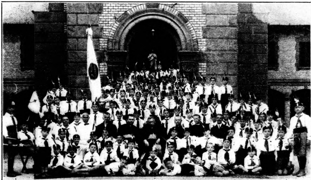
A pápai nuncius látogatása a Clarisseumban.