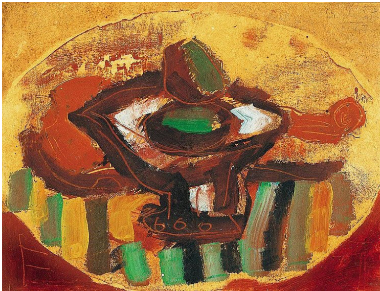
Bálint Endre: Csendélet