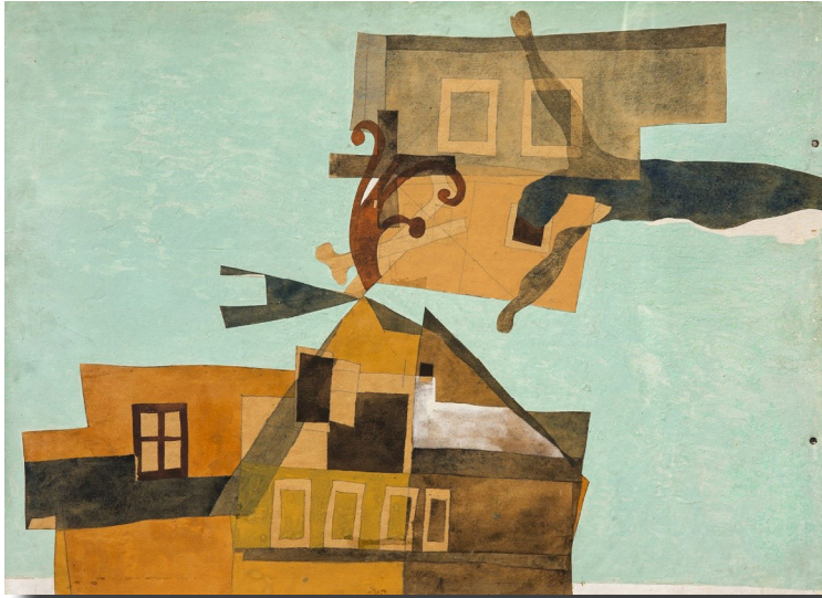
Bálint Endre: Szentendre felett az ég