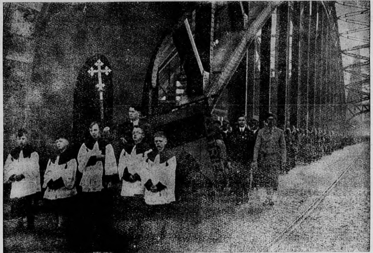
Processziók vonulnak a világ minden tájáról Kolping sirjához.

és társadalmi intézményeket? Mire segéd lesz, már legtöbbször el is felejt, hogy szülei és testvérei is voltak, vagy vannak és saját maga családalapítási lehetőségei sem valami rőzsásak. Képzeltető, hogy nem jól kereső, vagy hébe-hóba dolgozó, vagy egyáltalán munkanélküli, lerongyolódott iparossegédnek mi lehet az ismeretköre, ahová bejut, vagy akik őt befogadják, vagy behálózják. b) Második ok: a munkanélküliség . Ennek az oka pedig elsősorban nem az, mintha nem tudna állást kapni, hanem az, hogy nem tud . Egbekiáltó bűn az, amilyen szakmabeli tudatlansággal kienge-