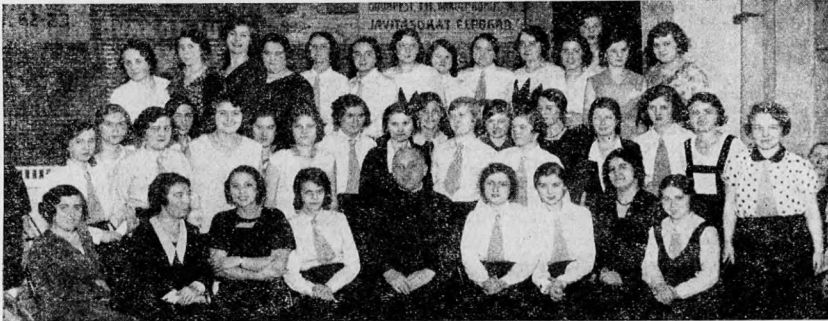
A „Napsugár Leányklub” tagjai

gár-leányklub nemes célját, szükségességét és az eszközöknek célra-vezető voltát. Nagyon jó, ha ezen beszéd elmondására a helybeli ft. Elnök urat kérjük meg, aki amugy is hivatásos szónok s ki mindjárt bemutatja a jövődó tagoknak a vezetőt, énekszámok, rövid aktuális szavazatok is felvehető ezen alakuló gyűlésünk programjában. Ha ügyesen állítottuk össze e gyűlések programját és annak minden pontját arravaló emberekre bízunk, a siker százszázalékos lesz.