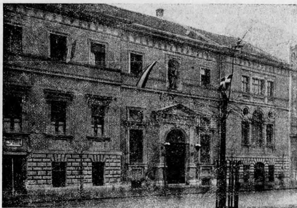
A Központi Székház

való eleven bekötöttség nélkül szármalmas torz az ember, a földön kiverett kutya. Programunk tehát: tagjainknak jelen családjukba való eleven bekötöttségét és jövőben alapítandó , Isten szíve szerinti családjukba való bekötöttségét hatékonyan szolgálni. A családban, a családból élésnek, családalapításnak, vezetésnek, védésnek, nevelésnek, szervezésnek sokféle erőre, ismeretre, eszközre, gyakorlatra van szüksége. Egyik legfontosabb eszköz és mód: a családi élet anyagiakban való megalapozása , anyagiakban történő állandó eredményes szolgálata, a megszerzett anyagi javak Isten szándéka szerint történő kezelése, megtartása. Mindez legteljesebben és legeredményesebben az Istentől gondviselészerűen juttatott hiva-