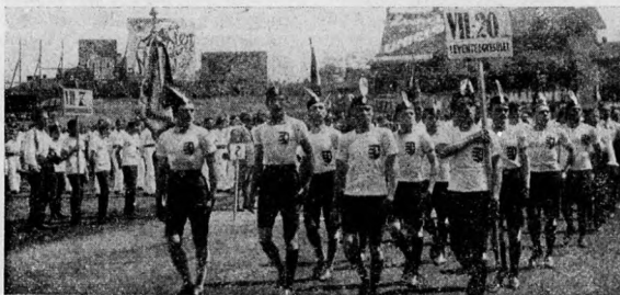
A központ leventéinek felvonulása

4. A krisztusi együttes új embert, erős embert, aktív termelő, teremtő embertypust jelent, ennek a típusnak rákköszöntését várjuk a reformifjúság mozgalmából és ez a típus fog csak igazán az egész ország közéletében maradandó boldogító reformot létrehozni. Ez az ifjúság az új nemessége az országnak, amely erejét és méltóságát nem a