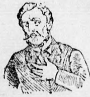
Megfojt ez az átkozott köhögés!