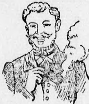
Egger mellpasztilla csakhamar meggyógyított