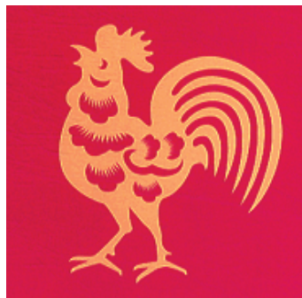
foly. a 3. oldalon

A kínai horoszkóp szerint január 28-án a kínai időszámítás szerinti 4714. esztendőbe, a kakas évébe lépünk. A Tűz Kakas illetve a Vörös Kakas jólétet jósol. (kép) A jólét nem terem csak úgy magától, képviselő-testületünk is megtett mindent annak érdekében, hogy a horoszkóp teljesülhessen. 2016-ban, azon felül, hogy több nagy beruházást is tető alá hoztunk, jelentős előkészületeket, pályázatokat nyújtottunk be a jövő érdekében, és reméljük, hogy a befogadott pályázataink az elbírálás során nyertesek lesznek.