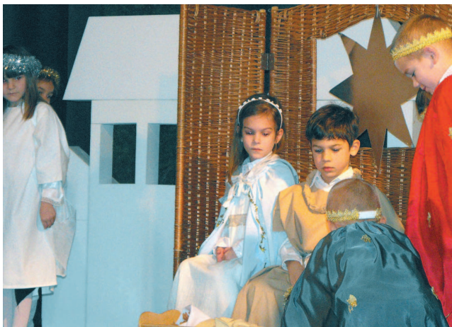
foly. a 2. oldalon