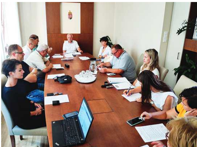
Folytatás a 2. oldalon