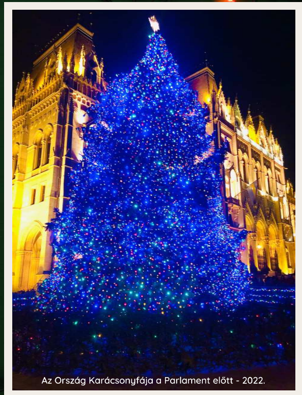
Az Ország Karácsonyfája a Parlament előtt - 2022.