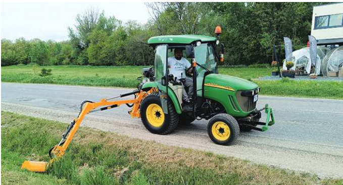
Folytatás a 3. oldalon

A Gamesz tavaly egy használt kommunális traktort és az azt kiegészítő karos zúzót is beszerzett, ami megkönnyíti a dolgukat.