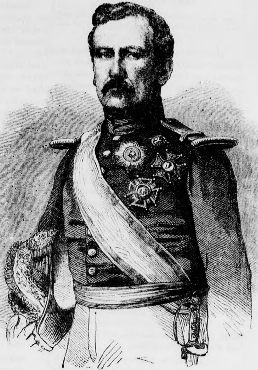
Ethague Rafael spanyol tábornok.