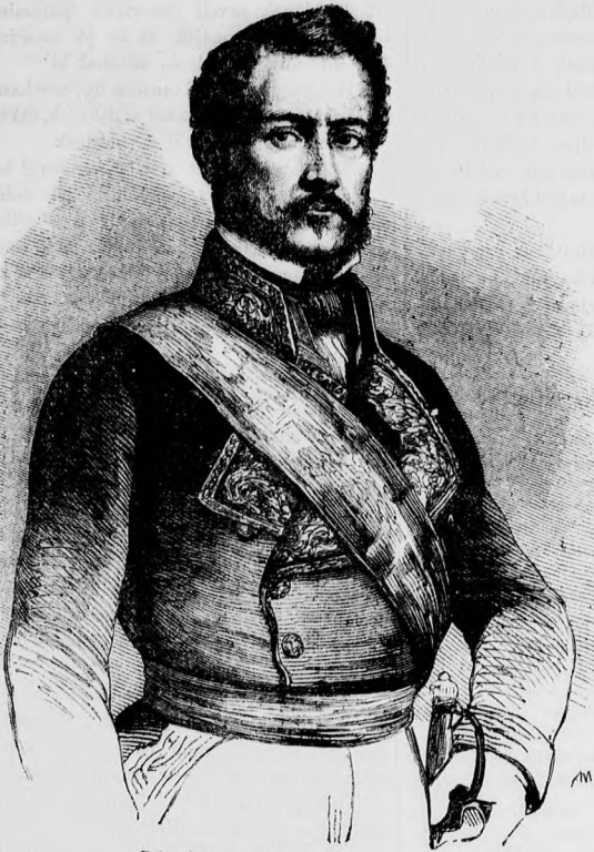
Prim Juan spanyol tábornok.