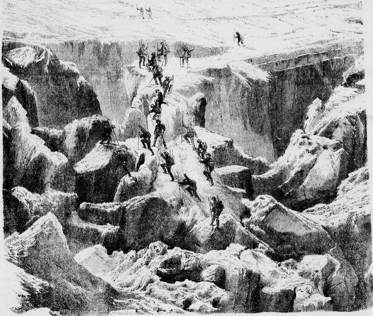
Fölmenet a Montblancra.

És ha sötét sirba szálltunk, Magunk és szent szabadságunk, Te adtad a koporsót.