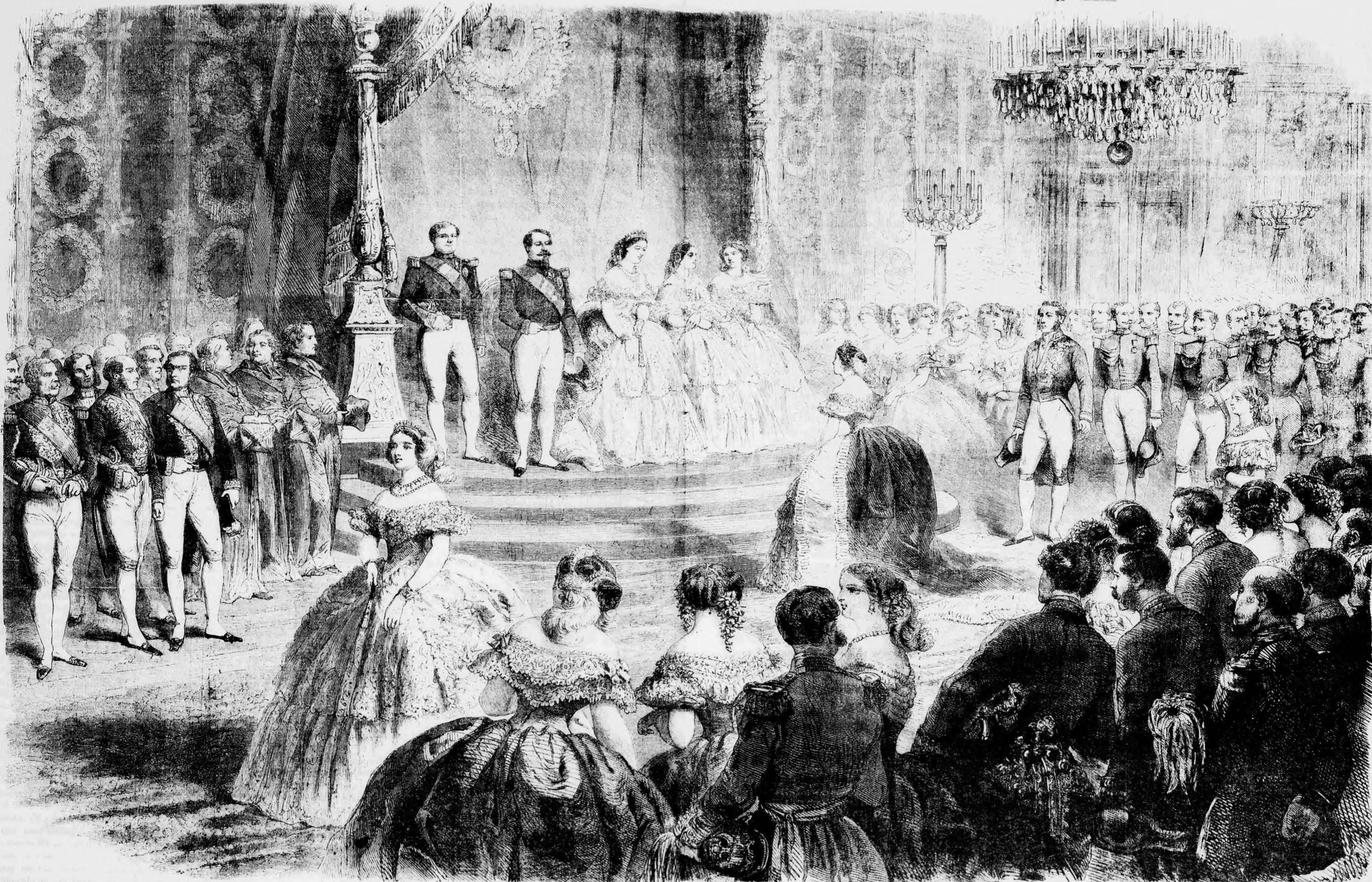
Nagy elfogadás az év első napján a „Tuillériák” palotájában.