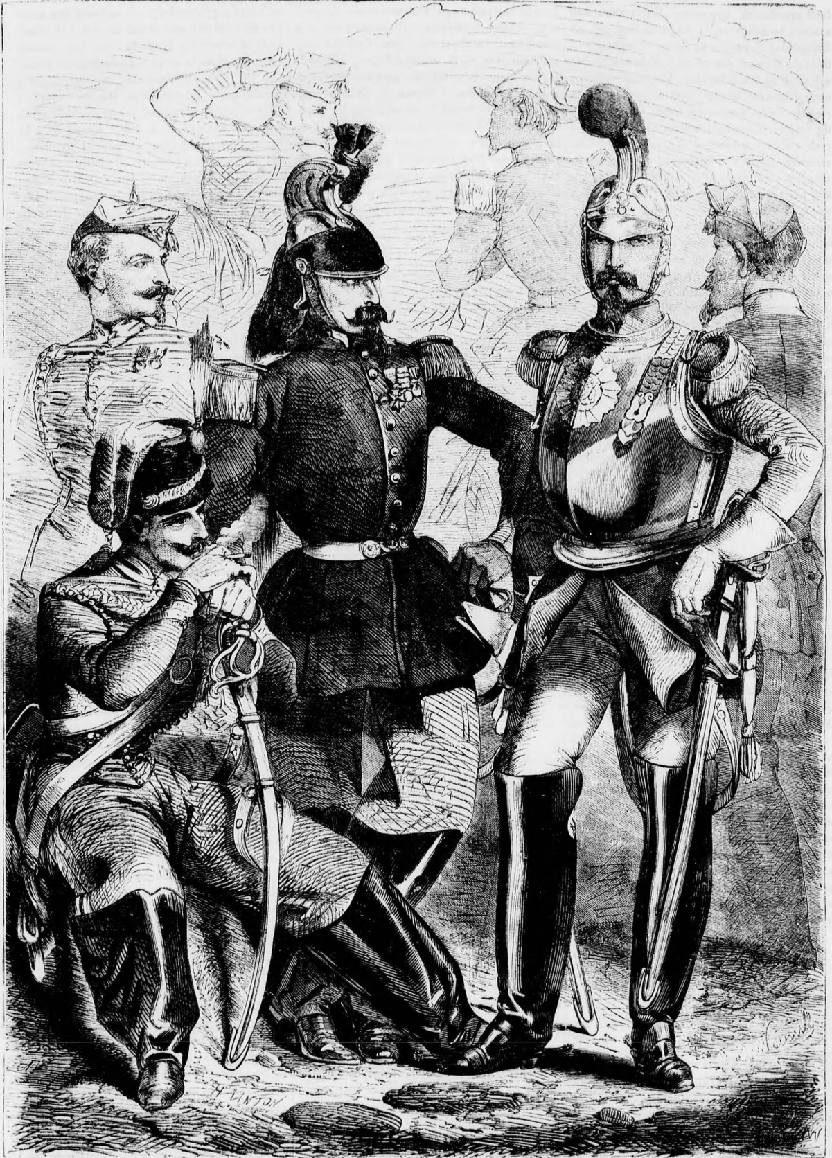
A francia lovasság új egyenruhája.