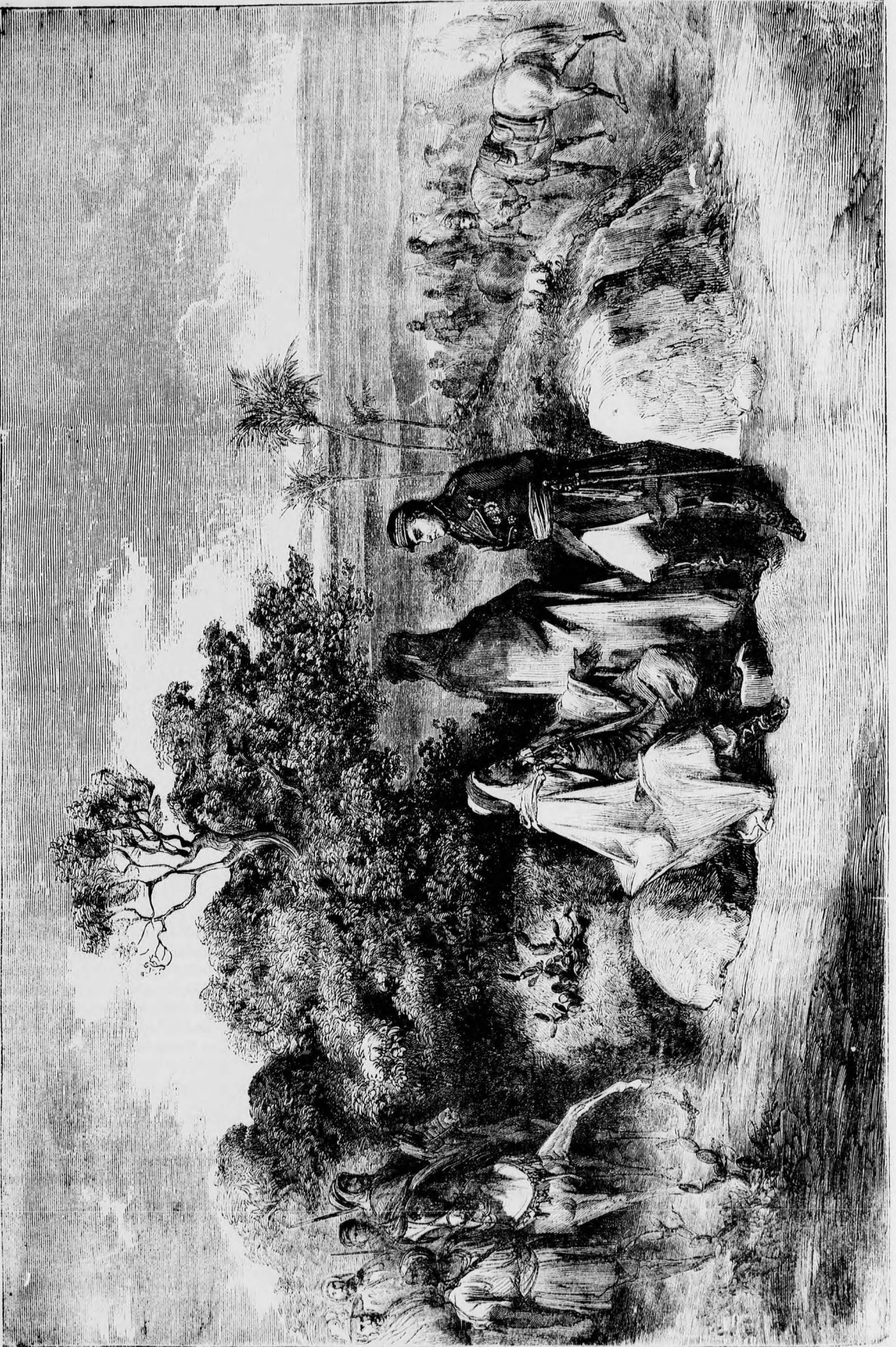
A tetvani herceg s Muley Abbas összejövetele a d' Osejai síkságron.