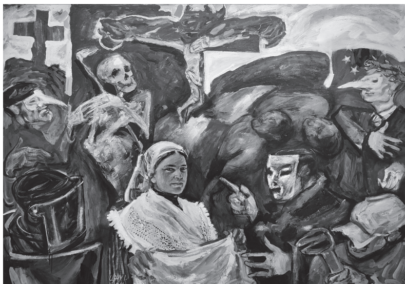
Szép új világ

Jön a játékos újra, összezúzza a zárat álmodon, rövidzárlat gyengédségeden, kisiklik újra a tér – s már kötéltáncos a pólusok között, úgy hitted, szilárd a valóság, de királya van a szavaknak, a megállíthatatlan hajón vagy, nehéz hullámok alattad. Feletted felhőbábok, őrtorony sincs az édes ködben. Pereg a homokóra, hiába fordítod meg, ugyanaz az idő forog veled, ami a térből kiesett, egy szót vársz, ami biztonságot adna, tudod, hogy jönni fog, bár későn ér a valóságba.