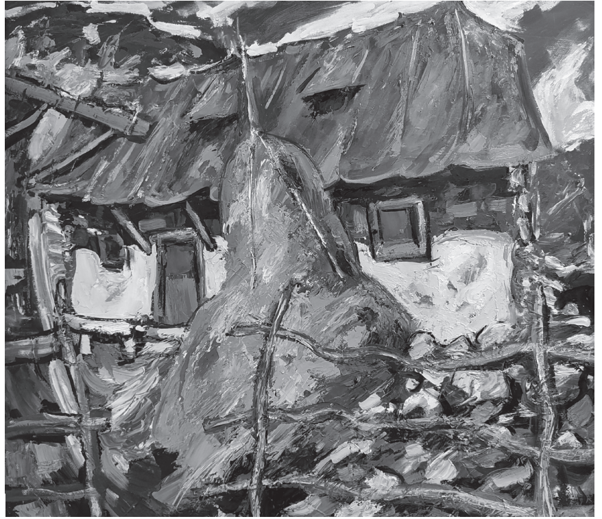
Régi ház Torockón

haszon. Alkotásain ezen kívül az a szemlélet is tükröződik, hogy az emberiség folyamatosan ugyanazokat a hibákat követi el, ugyanazokba a csapdába sétál, a világ és a társadalom a múltban sem volt sokkal másabb. Bármiben is hinnénk, legyen az Krisztus, a szabadság, az emberi jogok vagy a pénz, legbelül ugyanazok a gyarló emberek vagyunk, mint az idők kezdetén: a fejlődés csak illúzió, a lényeg nem változott.