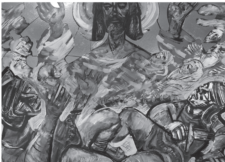
Hristos a înviat