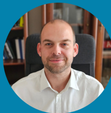
Fetter Ádám Polgármester