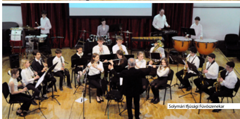
Solymári Ifjúsági Fúvószenekar