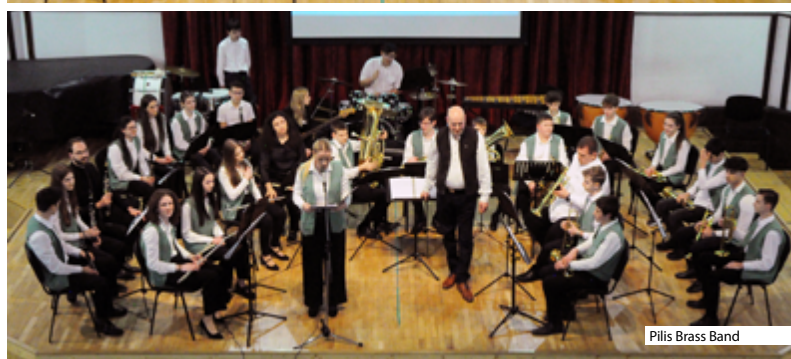
Pilis Brass Band