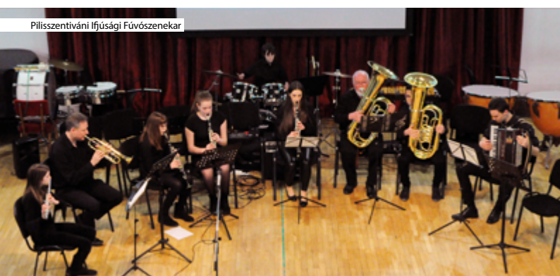
Pilisszentiváni Ifjúsági Fúvószenekar