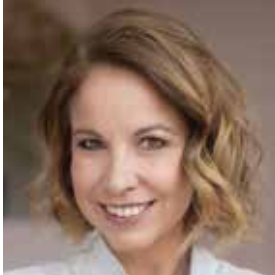
FORRÁS: MAGYAR TELEKOM