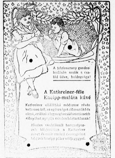
A háziaszony gondoskodásán mulik a család üve, boldogsága!

* Az időjárás szeszélyének minden ember ki van téve, ez az oka, hogy oly sok ember szenved csuzban és közvényben. A legelőkelőbb orvosok elismerik, hogy csuzos, reumás fájdalmakat nemcsak csökkentni, hanem meg is szüntetni a híres Zoltán kenőcs. Uvegeje 2 kor. Zoltán B. gyógytárban, Bpest, V., Szabadságtér.