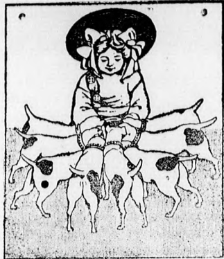
A legjobb kutyakalács volt és marad a

FATTINGER-féle KUTYA-KALÁCS, mely az összes fajta tápszerék közül a legjobb összetételű és tápértékű. — 10 kg. 23. — K., 5 kg. bérmentve 8.20 K. FATTINGER-féle PUPPY-BISQUIT kölyök-kutyák részére. 50 kg. 26. — K., 5 kg. bérmentve 8.50 K. — Árjegyzéket bérmentve küld Fattinger's Patent Hundekuchen- und Geflügel-Futter-Fabrik, Wiener-Neustadt. 250-nél (18bb elsőj.). — A Fattinger-féle tápszer állatorvos ellenőrzés mellett készül.