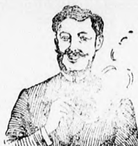
Egгер-mellpasztillája a katar meggyógyított!