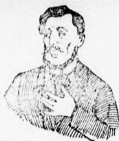
Megfajt ez az átkozott köhögés!

Köhögés, rekedtség és elnyájkosodás ellen gyors és biztos ha ásnak