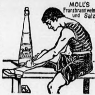
MOLL'S Frankfurt am Main und Salz

Csak akkor valódi, ha mindegyik üveg Moll A. védjegyét tünteti fel és „A Moll-féle” sós-borszesz egyetemes mint fűdalomcsillapló bédzrsőbéj szer-köszvény, eső és a meg-különböztető követke-zményeinek legismerteseb nepezer.