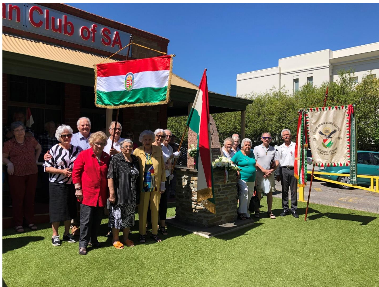
Dél-Ausztráliai csoportunk tagjai az adelaide-i Magyar Klub előtti hősi emlékműnél, március 15.-én