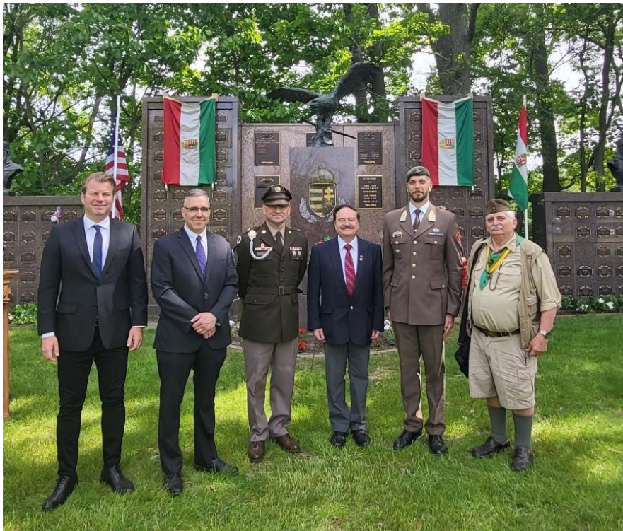
Hősök Napja Clevelandben 2023. május 28.-án. Sunset Memorial Park temető, magyar részleg a hősi emlékművel.

Napjainkban is van rengeteg lehetőség, ne mulasszuk el az alkalmat, mert ezek üdvösségünkre is szolgálnak. Tartsunk ki, mutatva a szeretet útját ebben az önző és haszonleső világban.