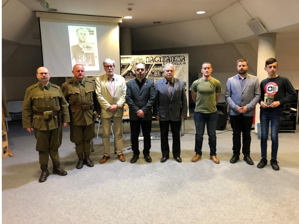
Szakály professzor és a szervezők

Felelevenedtek a régi történetek, amelyek mind-mind azt bizonyították, hogy a „régí” és az „új” Puma pilóták is bátor és összetartó bajtársi közösséget alkottak.