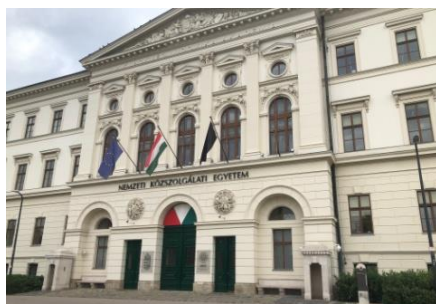
Az egykori Ludovika Akadémia

Az MHBK emléktábla-avatás képei, 2023. október 13.