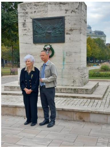
Az emlékmű előtt