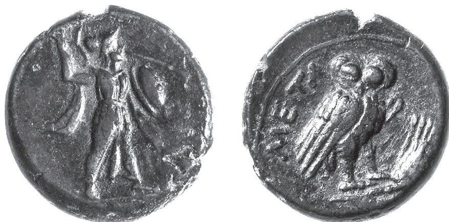
1. kép. Metapontioni bronz váltópénz Athéna Alkis és a bagoly alakjával. Kr. e. 3. század. British Museum, London

Az, hogy a metapontioniaiak a város saját érmekibocsátásaiban nem megszokott képpel ellátott típust választottak, olyan anomália, amelyhez hasonlót