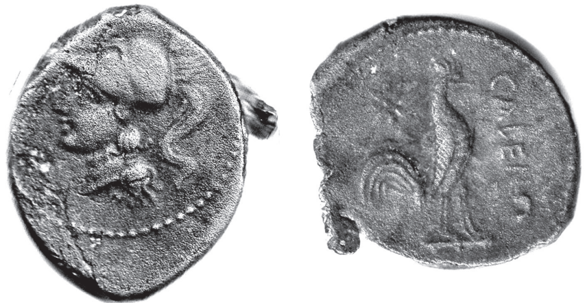
7. kép. Calesi bronzérme. Biassono Városi Múzeum, M.91.34.18. 6,25 g

A calesi menekültek, egykori vendégeik vendégeiként, a legnépesebb és legtekintélyesebb csoportot képezhették a boiú-