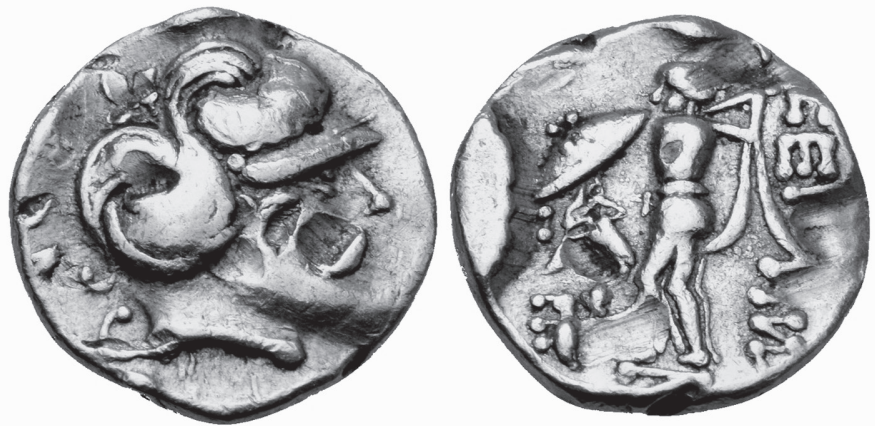
4. kép. Boius arany harmad-statér. 2,76 g

tudták megakadályozni, hogy a rómaiak előtt megnyíljon az út Mediolanum felé, amelyet Marcus Claudius Marcellus azonnal el is foglalt és ki is fosztott.