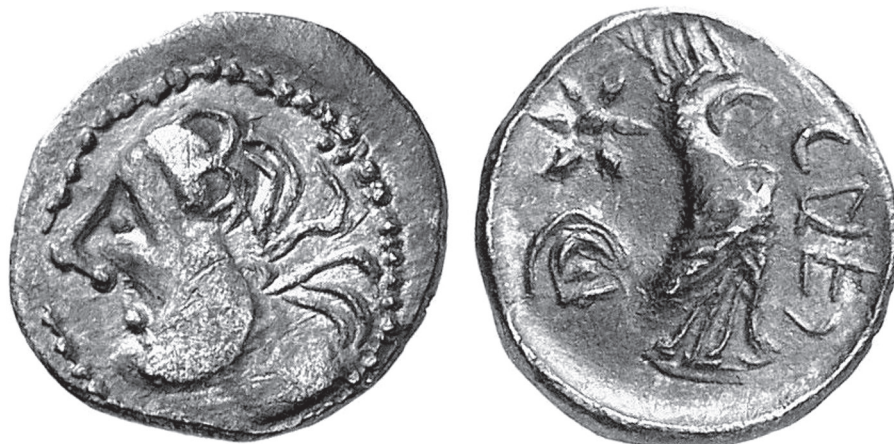
8. kép. Pseudo-calesi ezüstérme, 0,82 g. Kuenker, Auk. 312, 2018, n. 1925. 0,82 g (Torbágyi–Vida 2020 nyomán)

sok és tauriscusok földjére menekült közösségek között, de ott lehetek rajtuk kívül Capua, Suessa és a többi, a pun háború végén elhagyott város lakói is. Minden bizonnyal köztük voltak a boius Cispadaniából menekülők is, akik maguk is az érett La Tène-kultúra egy, már erősen a mediterrán kultúrával ötvözött változatának hordozói voltak. Végül talán ott voltak a Duna partján Metapontion menekültjei is, akik nem sok évvel azelőtt Athéna Alkis alakjával verettek bronzérméket, ugyanannak az istennőnek az alakjával, amely boius szövetségeseik pénzén volt látható, akkoriban, amikor mindannyian a makedón segítségben reménykedtek, amely végül nem érkezett meg.