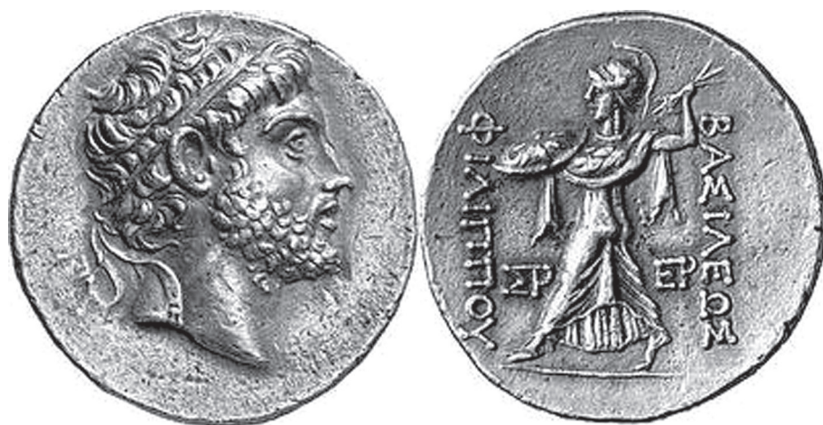
2. kép. V. Philippos makedón király tetradrachmája. Pella, Kr. e. 220 körül (forrás: „La moneta” numizmatikai fórum)

csak egyetlen másik esetben figyeltem meg Magna Graeciában, egy tarentumi ezüst diobolos esetében. 5 Ezt a különösen ritka típust, mely egy Héraklés-büsztt Athéna Alkis-ábrázolással, a szakirodalom általában final issue -ként, a Kr. e. 280 és 228 közötti évekre datálja. Arra tennék javaslatot, hogy éppen a választott típusok miatt helyezzük időben későbbre, a Kr. e. 212 és 209 közti évekre, amikor a város Hannibal kezére került. Kiadását így a korabeli politikai helyzettel magyaráznom, amely indokoltta teszi, hogy ezt a típust is az utolsó, a karthágói vezér Africába való visszatérése előtt kibocsátott sorozatok közé helyezzük. Nem is lehet elkerülni azt, hogy összekapcsoljuk az Athéna Alkis-típus választását a Hannibal és V. Philippos makedón király között 215-ben létrejött megállapodással, amely szerint utóbbi maga is beavatkozott volna Itáliában. Éppen a makedón király volt az, aki pénzérméi hátlapjára verette ezt a képtípust (2. kép), amely egyébként megjelent már korábbi makedón sorozatokban is (3. kép).