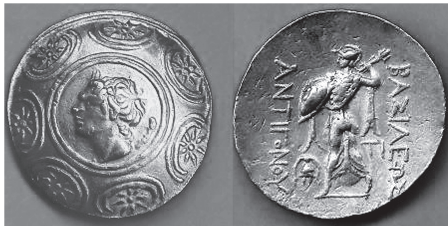
3. kép. Antigonos Gónatas (Kr. e. 277–239) tetradrachmája, Antipolis. 31,5 g

1912-ben ugyanis a toscanai San Vincenzo (Livorno) közelében lévő Campiglia Marittimában egy olyan arany kincsleletre bukkantak, amelyben több mint kétszáz, az Athéna Alkis típusával vert boius harmad- statér található 7 (4. kép). A lelet nagyrészt szétszóródott a műkereskedelemben, egy részét azonban közgyűjtemények vásárolták fel, köztük a Magyar Nemzeti Múzeum, amelynek éremtárában tizenöt példány van belőle. 8 Miután az együttes elrejtésének Kr. e. 1. századi keltezése meg-