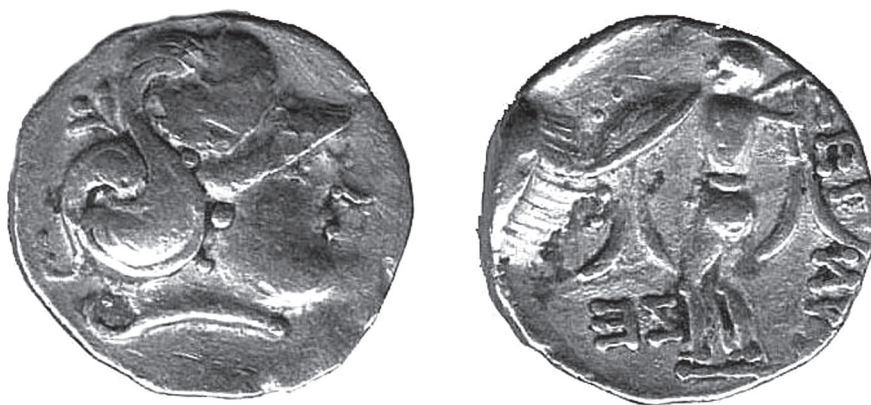
5. kép. Az alpokon túli boiusok harmad- statérja. 2,75 g

A boiusok lakta Cispadaniában így megjelent ezekben az években egy rövid életű, heterogén, soknyelvű, sokféle szokású közösség, 14 amelyről semmilyen híradás nem áll rendelkezésünkre és csak kevés tárgyi nyom, elsősorban éremleletek, köztük Cales és Suessa Aurunca érméi. 15 Nem sok évvel később, amikor a római terjeszkedés óhatatlanul visszatért a Pó vonaláig, újra összekapcsolódott Placentia és Cremona addig elszigetelt előőrseivel, és felkészült a további hódításokra, a cispadaniai boius közösség kénytelen volt az Alpokon túlra költözni, oda, ahol még úgy tűnt, hogy a biztonságukat sza-