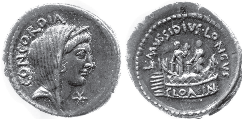
2. kép. L. Mussidius Longus ezüst denariusa, Kr. e. 42. Concordia, Venus Cloacina szentélye, az istennő két szobrával (British Museum, 1843,0116.824)

Pauw három lehetséges okkal magyarázza Livius narratívájának feltűnő drámaiságát: (1) Róma korai történetének természetében drámai, mivel heroikus tettek és pátosz jellemzi. (2) Befolyásolja az a konvenció, hogy tragikus-patetikus technikával ábrázolja a történelmet. (3) Olvasói elvárásait