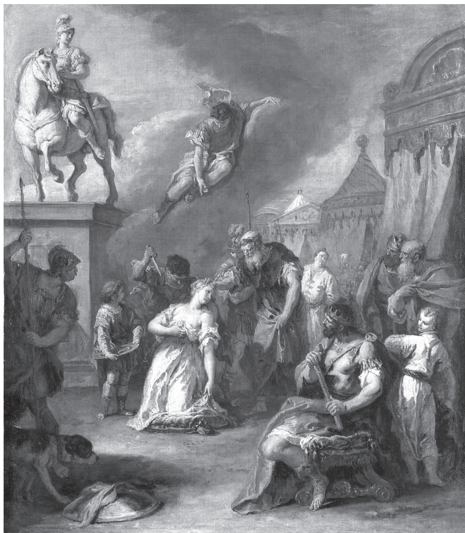
4. kép. Sebastiano Ricci: Polyxena feláldozása . 1726–1730 körül, olaj, vászon (Royal Collection Trust, The Queen's Gallery, Edinburgh, ltsz. RCIN 404763)

A kommentárok kiemelik, hogy ezt a gesztust, vagyis hogy Polyxena még halála előtt is arra ügyel, hogy elfedje szemérmét, Ovidius Euripidéstől kölcsönözte ( Hekabé 569–570); 44 elemzésünk szempontjából a görög minta, az irodalmi hagyomány nem kevésbé fontos, viszont érdemes megfigyelni – hasonlóan a korábbi példákhoz –, hogyan romanizálja és alakítja „ovidiusivá” Polyxena történetét, s illeszti be textuális hálózatába; oda, ahová mint egy szépen kimunkált mozaikkövecske éppen beillik. Euripidés Polyxenéjének transzformációjában Ovidius – Gross szerint – odáig megy, hogy a nemes trójai királylányból egy zavarodott, magával is gyakran ellentmondásba kerülő – a retorikai gyakorlatokból Hypereidés nyomán ismert – csábító kurtizánként jelenik meg. 45 Az ovidiusi játékoság ebbe az irányba is elmozdíthatja az értelmezést, de a paródia a legritkább esetben áll magában, s lesz öncélú esz-