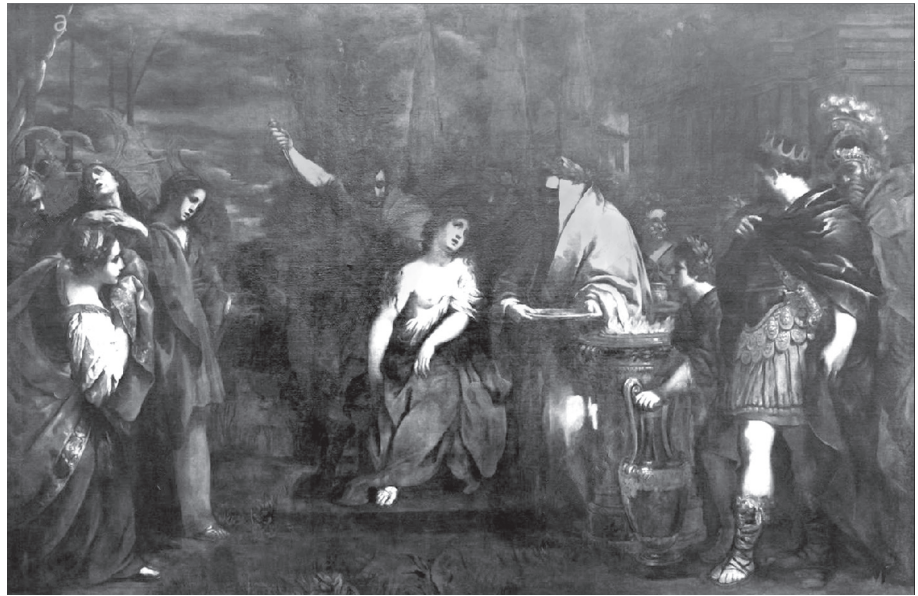
3. kép. Pietro da Cortona: Polyxena feláldozása . 1620 körül, olaj, vászon (Musei Capitolini, Róma)

Ahogy Horatius esetében ( Serm. II. 3, 200), úgy a Metamorphoses idézett sorai kapcsán sem lehet figyelmen kívül hagyni az áldozatnak kiszemelt Iphigenia Vestával és a Vesta-szüzekkel meglévő hasonlóságát, a szöveg által is kiemelt kapcsolatát. A római rituális tapasztalatot és e szféra szókincsét mozgósítja mindkét esetben a költői nyelv, amely e gesztussal romanizálja és egyben tovább problematizálja az emberáldozat kérdését a görög és római – ha egyáltalán elválasztható – kulturális és iro-