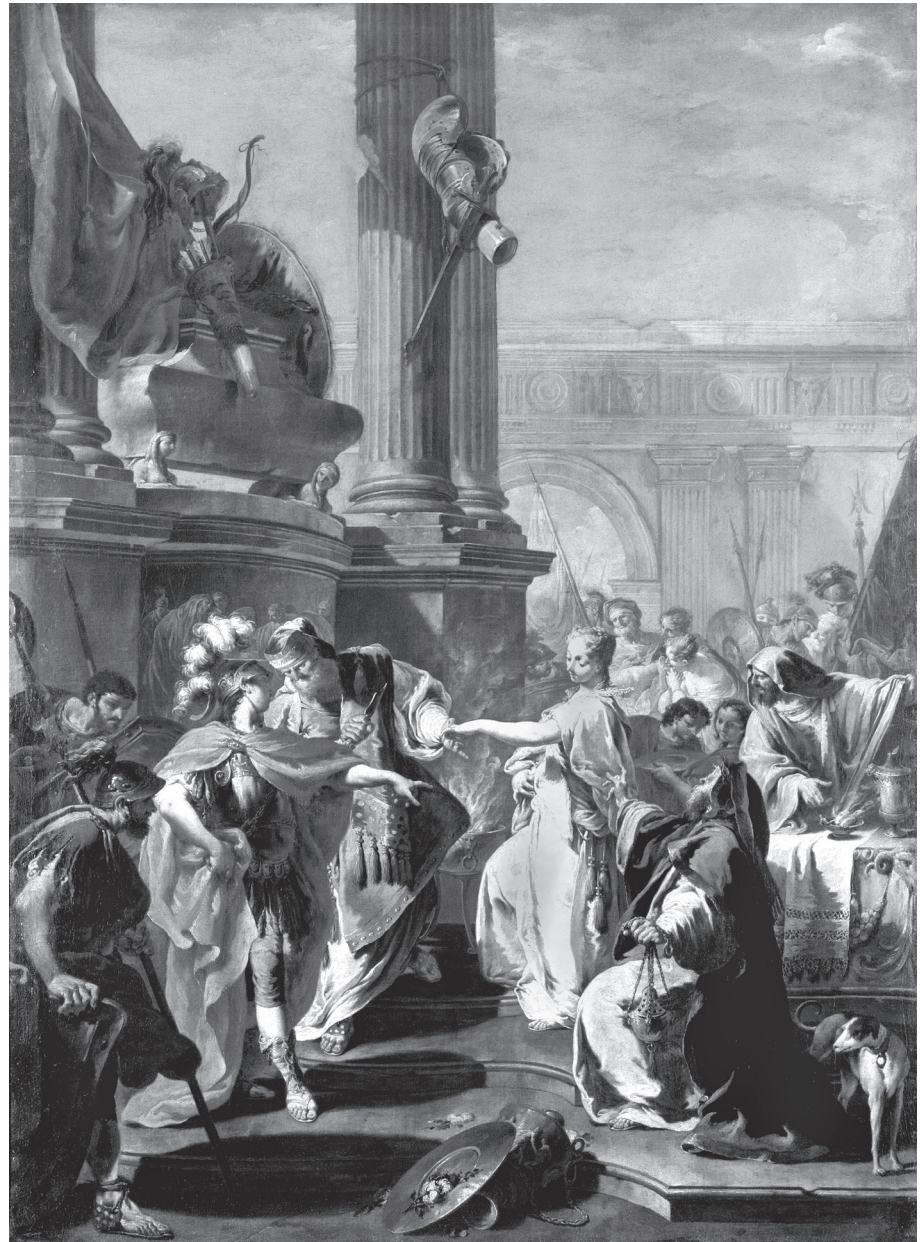
2. kép. Giovanni Battista Pittoni: Polyxena feláldozása . 1730 körül, olaj, vászon (Ermitázs, Szentpétervár, ltsz. ГЭ-8464)

Amikor Cicero arról értekezik a De officiis -ben, hogy minden körülmények között meg kell-e tartani a fogadalmat, kifejti, hogy – példának okáért – Iphigenia esetében inkább ne tartotta volna meg Dianának tett fogadalmát Agamemnon, aki gyalázatosabb tettet követett el ígérete betartásával ( Promissum potius non faciendum quam tam taetrum facinus admittendum