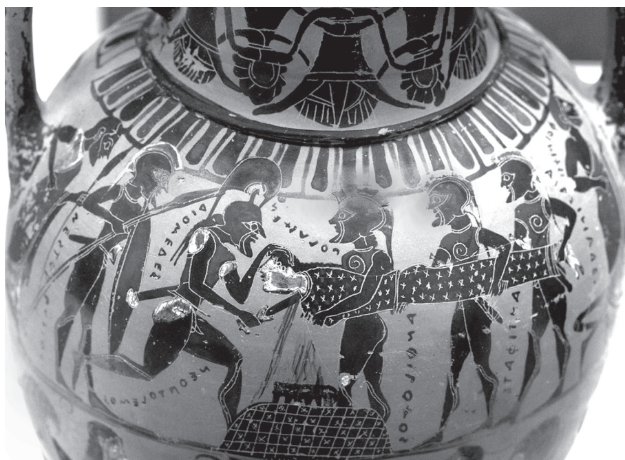
1. kép. Polyxené feláldozása. Attikai feketealakos amphora, Kr. e. 570–550 körül (British Museum, London, ltsz. 1897,0727.2)

Az itáliai barokk – mitológiai témákat kedvelő – festészete is kedvét lelte a trójai királylány halálának feldolgozásában. E festmények azért is tarthatnak figyelmünkre számot, mivel az a felfokozott – szinte már giccsbe hajló – pátosz, ahogy a témát, a halni induló szűz alakját megragadták, Ovidius feldolgozásához jóval közelebb áll, mint a röviden jellemzett feketealakos váza. Giovanni Battista Pittoni (2. kép), Pietro da Cortona (3. kép) vagy Sebastiano Ricci (4. kép) képein Polyxena kiszolgáltatottsága nem egyeduralgkodó motívum: bár a halálra szánt lányt kényszerítik, mégis megőrzi királyi származásának fenségét, valamint szűzi tisztaságát. Ovidius Metamorphoses -ben az életével leszámolt szűz önként lép a paphoz, aki a köröttük álló görögökkel