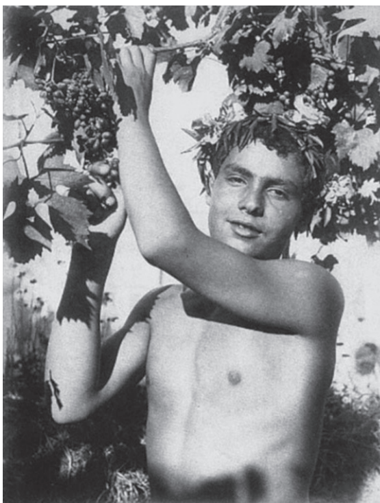
2. kép. Dionysosként pózoló taorminai fiú. A Barthes által nagyra becsült (gyűjtött, kiadott) W. von Gloeden felvétele, 1900 körül

„Mondd csak, ó, Sókratés, mit felelnél az isteneknek, ha megjelenének előtted, és így szólának hozzád: 26 »Hát nem tudod, Sókratés, hogy semmi sem történik lenn a földön a beleegyezésünk nélkül, s hogy a halandók egyetlen haja szála sem görbül, ha mi nem úgy akartuk? 27 Mondd, ugye tudod?« – »Persze, tudom« – mondanád erre te. »Akkor tehát – mondanák az istenek –, amikor Kritón felajánlotta, hogy megszökj, nemde mi voltunk azok, akik őt erre ösztönöztük?« – »Kétségtelenül.« – »Mondd hát akkor, Sókratés, melyik embert gondolod bűnösebbnek, azt, aki az itteni, lenti törvényeket szegi meg, vagy azt, aki az istenek íratlan törvényeit hágja át?« – »Kétségtelenül azt, aki az istenek íratlan törvényeit« – felelnéd erre. »Akkor tehát« – folytatnák az istenek – »nemde te vagy ez a bűnös, aki inkább kívánsz a halandóknak engedelmeskedni, mintsem nekünk, isteneknek, akik nyilvánvaló jelét adtuk akaratunknak? Fontold meg mindezt, Sókratés, aztán engedelmeskedj nekünk és menekülj!« Így beszélne hozzád az istenek: és te, Sókratés, mit felelnél nekik?»