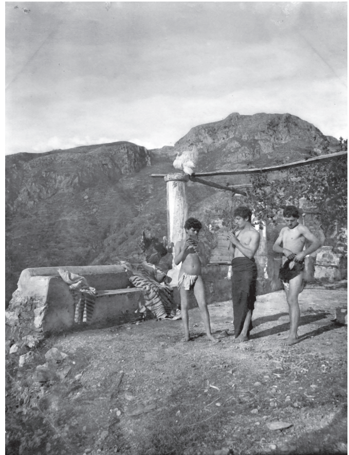
3. kép. Pszeudo-antik zenélő pásztorfiúk. 1900 körül

„Sókratés nincs messzire attól, hogy engedjen Alkibiadés szavainak – gondolta –, alig valami hiányzik, hogy a szökés mellett döntsön, épp csak jól kell megválasztani ezt a valamit.” Ezzel észrevétlenül odaintette magához Leukithést, a börtönőrt és pár szót a fülébe sűgött. 29 Az kiment. Sókratés nem mert megszólalni. Hogyan is titkolhatná el tanítványai előtt, hogy szavaik sokkal mélyebben érintették, mint amennyire látszik? Alkibiadés beszéde hatott rá leginkább, fájdalmas kísértésként. Ami azt illeti, valóban sokat gondolkodott a Kritónnal és Phaidónnal folytatott beszélgetések után. Kettejük érvei átfórmálták, s most kínosnak találta feláldozni magát olyan hiábavaló és kevéssé becses dolgokért, mint a törvények. Attól is félt, hogy kellemetlen helyzetbe hozza a barátait; végezetül pedig az jutott eszébe, mennyire szerencsétlen is lenne, ha tanítása ilyen váratlanul szakadna félbe, anélkül, hogy bármilyen formában is intézkedhetné a folytatásról. Mindazonáltal, túl ezeken az észérveken, valami tompa bizsergést érzett magában, amely (neki egyedül legalábbis úgy tűnt) mindenképp meg kell, hogy ingassa: valamiféle vágy volt, aminek semmi köze a szellemhez, annál inkább a testhez. Sókratés nem tudta pontosabban meghatározni: valami