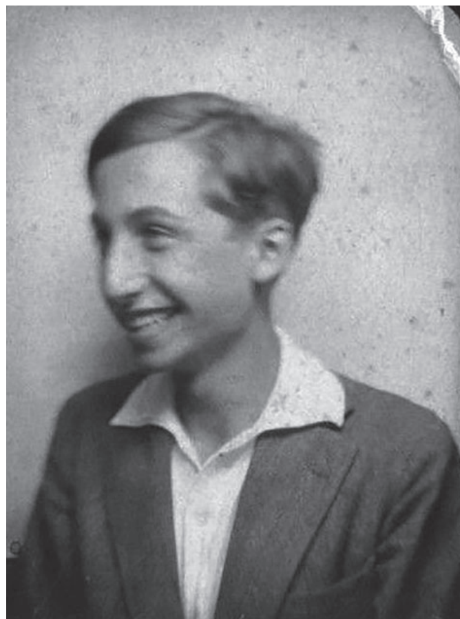
1. kép. Az ifjú Barthes. 1930 körül