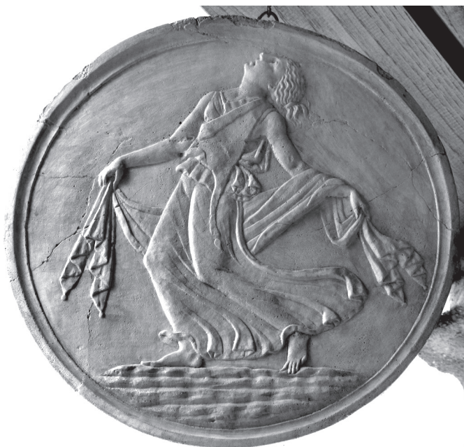
3. kép. Oscillum backhánsnő-motívummal. Herculaneum, Casa del Rilievo di Telefo

Dionysos neve azonban nem pusztán politikai metafora, hanem a magánmisztériumok és a dráma világának felidézője. A Vezúv-területről ismert freskók, domborművek mutatják: Bacchus ábrázolásai és a bacchusi motívumok két csoportra