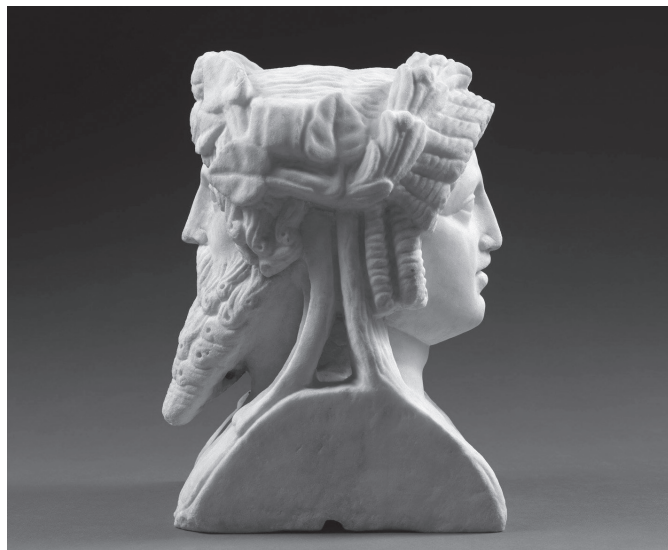
2. kép. Apollón és szakállas Dionysos. Castello Aragonese di Baia

A szakirodalomban visszatérő állítás, hogy Nietzsche megközelítése vallás- és irodalomtörténeti szempontból többszörösen is pontatlan: Apollón és Dionysos szembeállítására téves, a két isten kultusza szorosan összekapcsolódott akár Delphoiban, akár Athénban, 86 illetve A tragédia születésében apollóninak és dionysosinak címkézett ókori görög műfajok elemzése kapcsán is sok a tévedés. 87 Azon túl, hogy a nietzschei megközelítés és az ennek hatására született művek elhomályosítottak más tudományterületről érkező fontos Dionysos-értelmezéseket, 88 fölmerült az igény: talán jobb lenne egy „sans Nietzsche” 89 irányzat a klasszikus antikvitás kutatásában. Másrészt fontos tudatosítani, hogy Nietzschnél a két isten elsősorban két filozófiai fogalom, a schopenhaueri akarat és képzet allegorikus