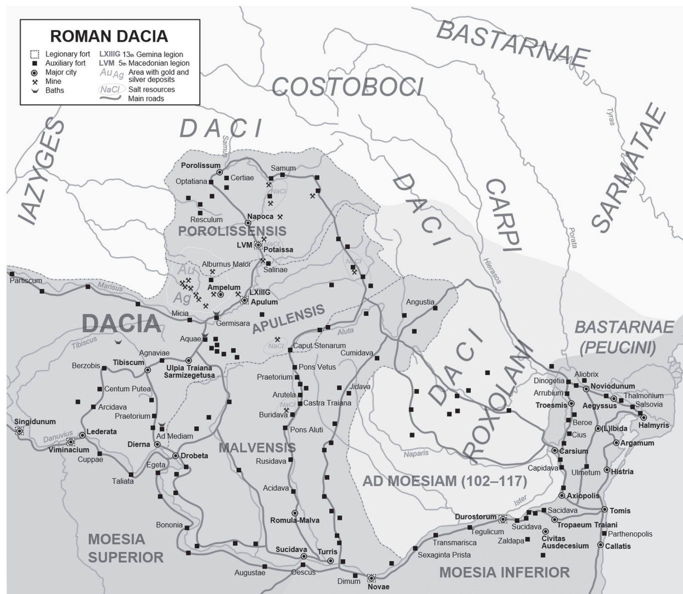
1. ábra. Dacia határvonala a korábbi román nézet szerint

Ezt a nézetet az teszi elfogadhatatlanná, hogy tudjuk, az Olt-menti auxiliáris erődök ebben az időben is használatban voltak, a csapatok nem hagyták el őket, az pedig nem szorult különösebb indoklásra, hogy a csupán őrtornyokból és kiserődökből álló vonal a maga csekély létszámú haderejével nem lett volna képes feltartóztatni egyetlen komolyabb barbár támadást sem. A kérdést a sáncvonal régészeti kutatása és elemzése mellett az döntheti el, hogy milyen provinciális megtelepedésre utaló nyomok vannak a katonai létesítmények közelében, illetve a „ limes transalutanus ” és az Olt között. Az utóbbi évtizedekben fellendülő, szép eredményeket felmutató régészeti topográfiai kutatások mindmáig egyetlen római provinciális települést sem tudtak kimutatni ezen a területen, annál inkább a szabad dákknak tartott, római tárgyakat is tartalmazó, Chilia-Militari kultúra 2–3. századi emlékanyagát.