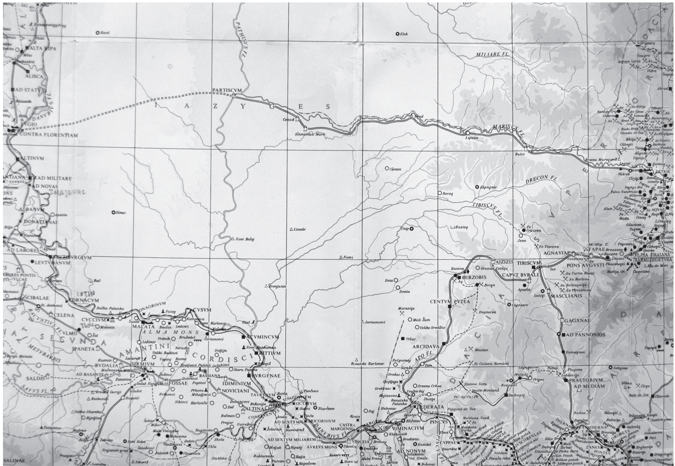
2. ábra. A tabula imperii Romani L 34 lapjának részlete Dacia nyugat felé nyitott határával

A sáncvonal limes ként való értelmezése tehát elképzelhetetlen, de a kérdés továbbra is fennáll, milyen célból hozta létre Róma ezt a rendszert, és hogyan tudta azt biztosítani és fenntartani a szarmata roxolán települési területen. A második kérdésre könnyebb válaszolni, mint az elsőre. A markomann–szarmata háborúk lezárását követő, Commodus (Kr. u. 180–193) által kötött békeszerződések a Duna-vidéken római hegemoniát biztosítottak az itt élő germán és szarmata népek fölött. Ennek eredményeként római épületek is létesültek barbár földön, és római tisztek gyakoroltak bizonyos értelemben felügyeletet az egyes törzsek fölött, amint arra vonatkozó adatokkal rendelkezünk a Pannoniától északra élő kvádok esetében. Ugyanitt fordult elő, hogy a békét megtörni készülő kvád királyt, Gaiobomarust Caracalla (Kr. u. 211–217) egyszerűen magához rendelte és kivégeztette. Noha nem rendelkezünk hasonló adatokkal a Dacia inferior előterében élő roxolánokkal kapcsolatban, de feltehető, hogy ezen a határvonalon is hasonló rendszer működött, elősegítve a római hegemonia és a béke fenntartását.