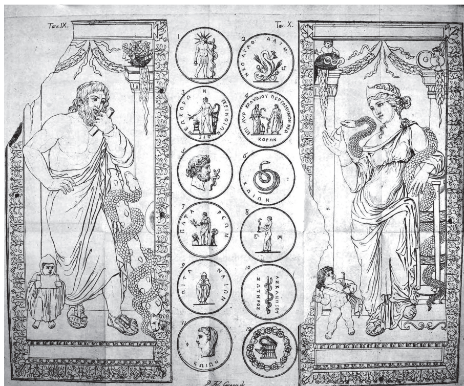
10. kép. Felice Caronni rajza és metszete az Asklépios és Hygieia-diptychonról. Caronni 1806, IX–X. tábla