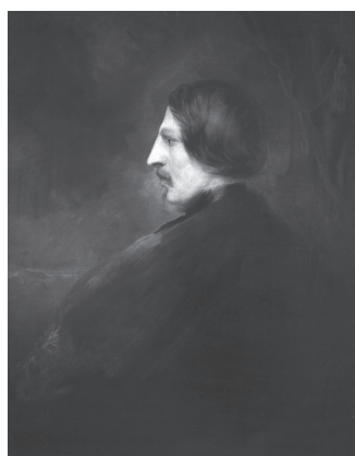
3. kép. Wolfgang Böhm: Pulszky Ferenc , 1849, olaj, vászon. Magyar Nemzeti Múzeum, Budapest, Történelmi Képcsarnok, ltsz. 1552