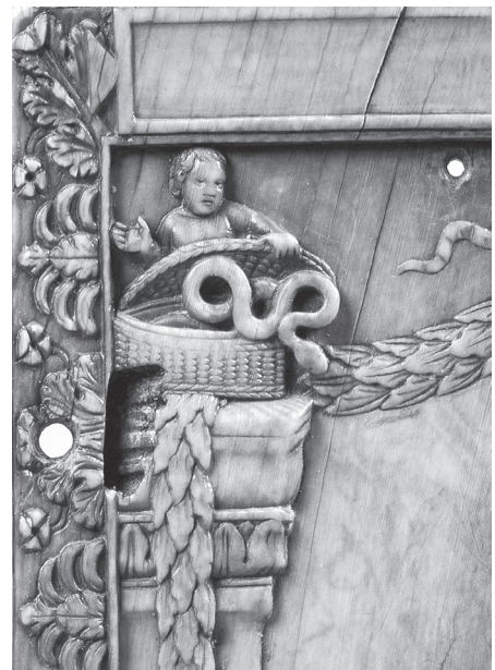
7.c kép. Asklépios és Hygieia-diptychon, részlet: gyermekalak fedeles kosárral