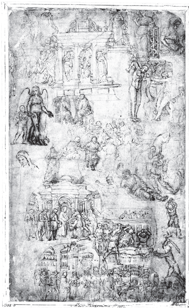
8. kép. Ismeretlen mester: Vázlatok egy műgyűjtemény tárgyairól , Itália, 1500 körül, tollrajz, papír. Hamburger Kunsthalle, Kupferstichkabinett, ltsz. 21205

Első teljességre törekvő katalógusuk a 18. század közepén jelent meg egy háromkötetes, metszetekkel illusztrált díszmű formájában. A nagy hírű firenzei régiségbűvár, Antonio Francesco Gori (1691–1757) posztumusz művét 38 a kor talán még nevezetesebb régiségbűvára, Giovanni Battista Passeri (1694–1780) rendezte sajtó alá, aki egy negyedik kötetet is összeállított Gori hátrahagyott följegyzéseiből néhány további elefántcsont-faragvány ismertetésével. E „függelék” egyik fejezete szól az Asklépiost és Hygieiát ábrázoló táblákról (9. kép). 39 A szöveg szerint a diptychon csupán a 14. század után keletkezhetett, mert a főalakok körül látható részletek halmozása