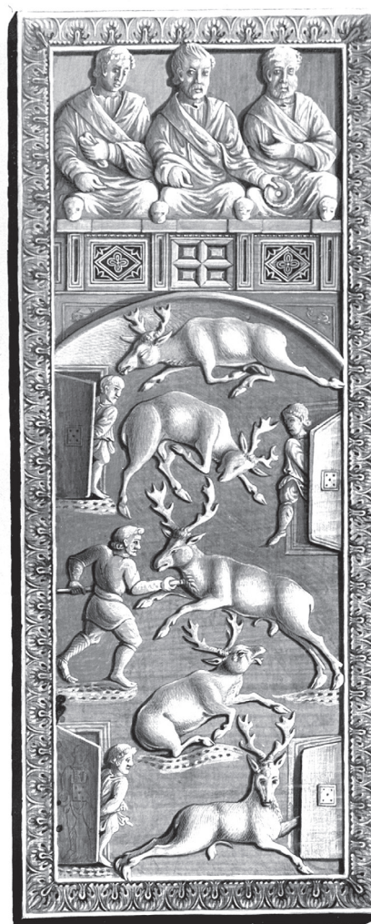
14. kép. Petrás István (?) felvétele a Liber Antiquitatis Wolfgang Böhmnek attribuált akvarelljéről: a Liber Antiquitatis 147. lapja. Üvegnegatív, 1930-as évek. Szépművészeti Múzeum, Budapest, Antik Gyűjtemény, Fényképtár, ltsz. A 4858 © Szépművészeti Múzeum