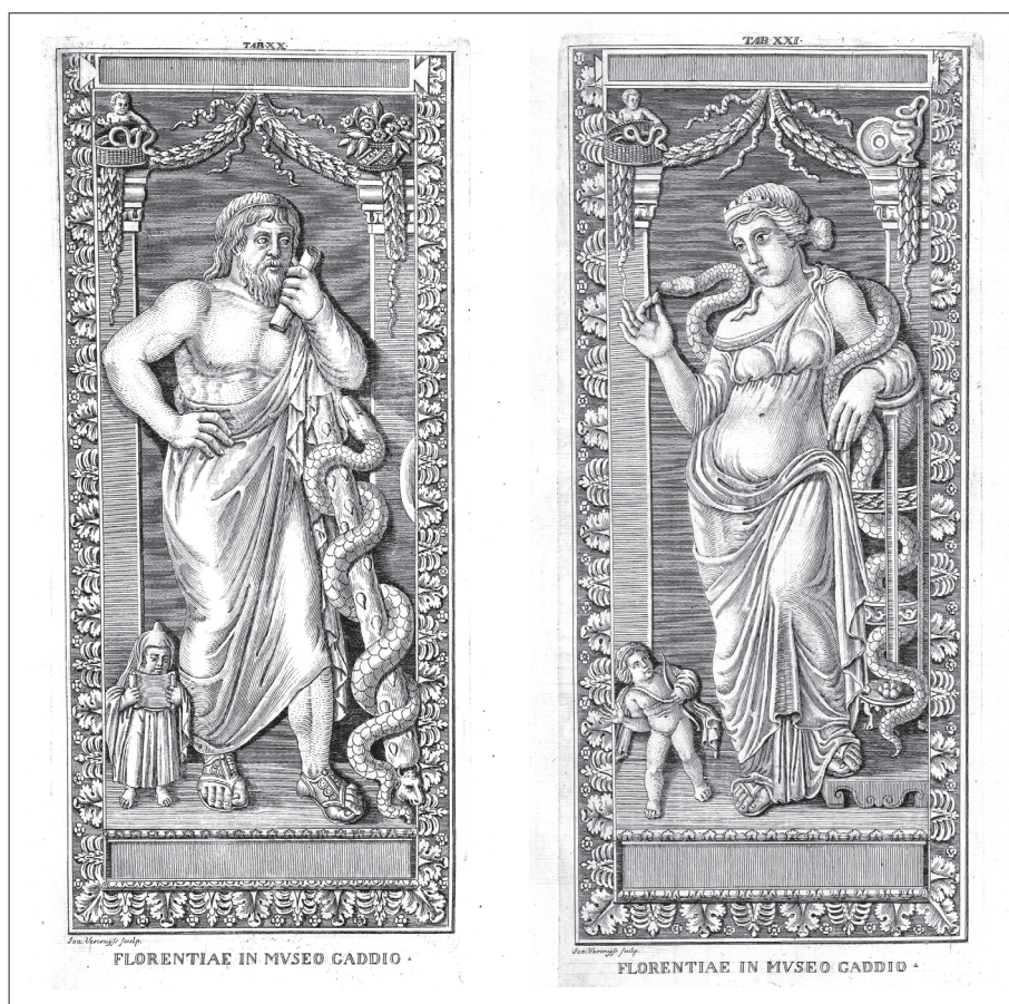
9. kép. Ismeretlen rajzoló – Johannis Vercruys metszete: az Asklépios és Hygieia-diptychon. Passeri 1759, XX–XXI. tábla

Gróf Viczay (II.) Mihály (1756–1831) tudós gyűjtőként elsősorban az ókorban vert érmek teljes sorozatainak összeállítására törekedett. Caronni 1791-ben tartózkodott nála először hédervári kastélyában, hogy segítsen összeállítani numizmatikai gyűjteménye katalógusát, majd később metszet-táblákat készítsen annak kiadásához. 47 Viczay nagy utazásokra küldte őt, főként azért, hogy a gyűjteményéből még hiányzó, ritka vereteket keressen neki; de például Caronni bonyolította le Nürnbergben Viczay számára az ún. Diptychon Negelianum megszerzését