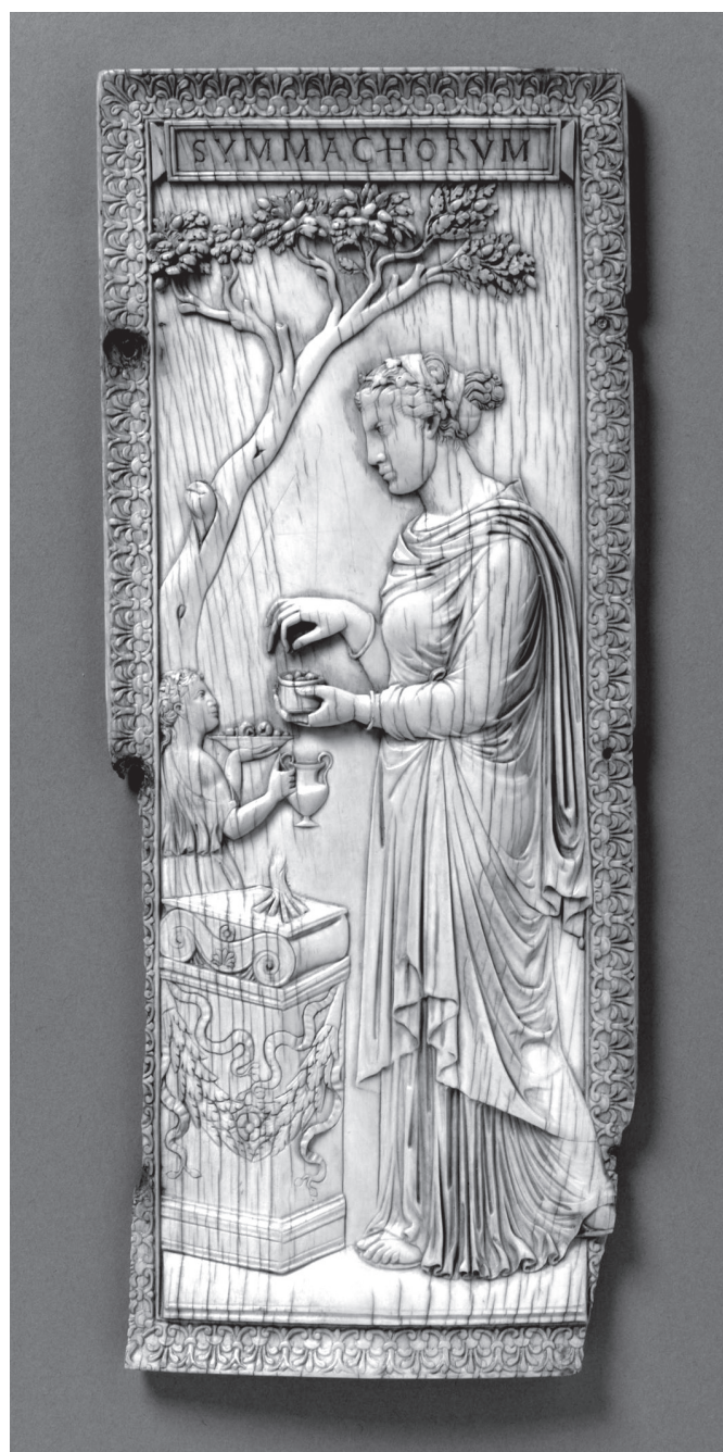
5. kép. A Symmachus és Nicomachus családok diptychonjának jobb szárnya. Róma, 5. század eleje, elefántcsont. Victoria and Albert Museum, London, ltsz. 212-1865

A 4. és az 5. század fordulóján a legvagyonosabb és legbefolyásosabb nyugatrómai előkelők 7 többféle alkalomhoz kötődően is diptychonokat küldtek ajándékba hasonlóan gazdag és hatalmas barátaiknak. Ezeket a kutatók hosszú ideig a consuli megrendelésre készült és általuk ajándékozott diptychonokkal azonos kategóriaként kezelték, megnevezésükre is a consuli diptychon kifejezést használták. A fent már idézett 384-es rendelet, valamint Claudianus Stílichót dicsőítő egyik költeménye ( De consulatu Stilichonis III. 346–349) és Anicius Probus 406-ra keltezhető faragványpárja 8 alapján consulok valóban