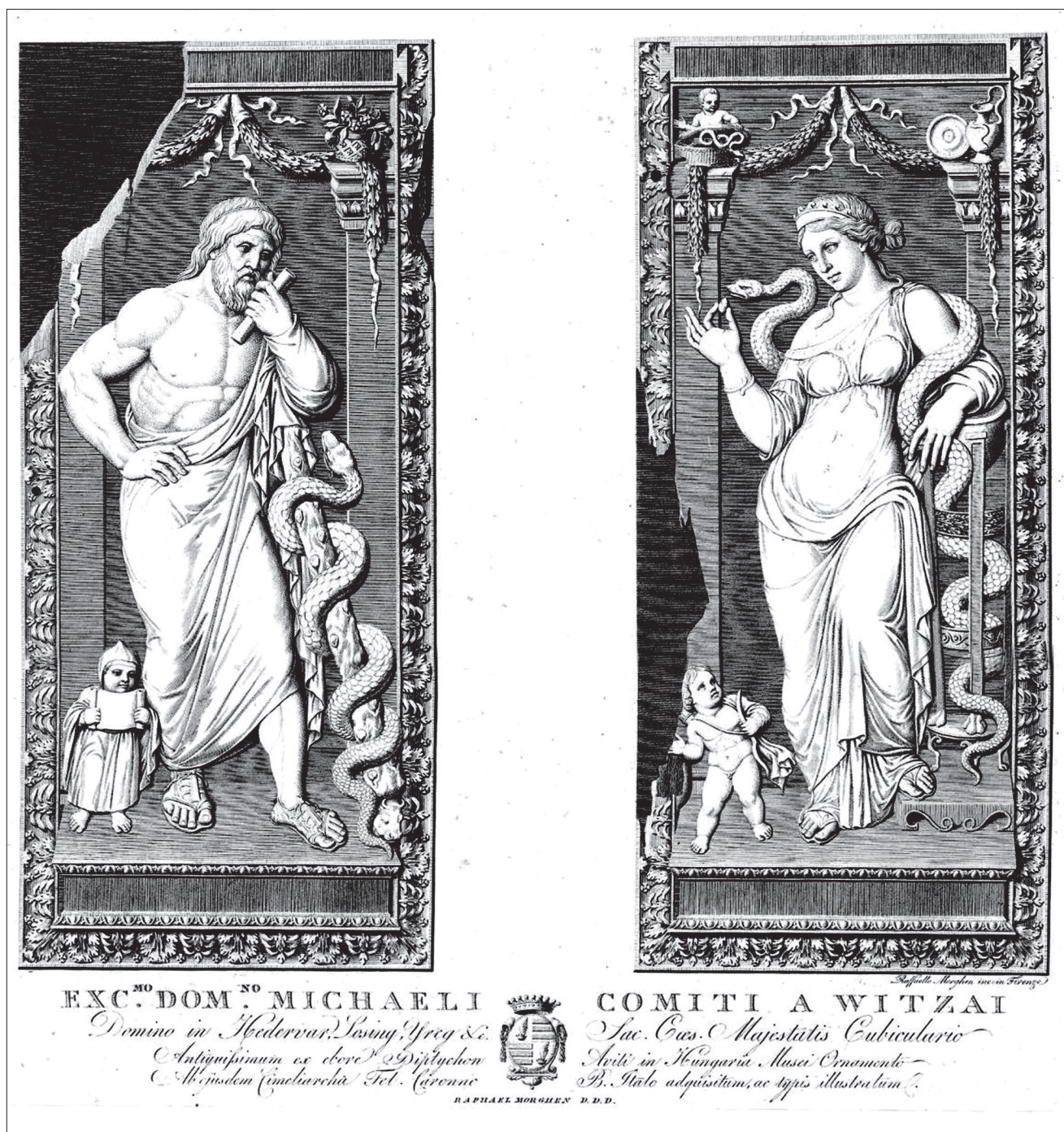
11. kép. Raphael Morghen metszete a diptychonról Viczay Mihálynak szóló ajánlással, 1805

is. (Ez Taurus Clementinusnak, az 513. év consuljának elefántesont diptychonja, tábláinak hátoldalán 8. századra datált görög nyelvű feliratokkal, amely – legalábbis a 18. században – a Negelein nevű nürnbergi patríciuscsalád birtokában volt. 48 )