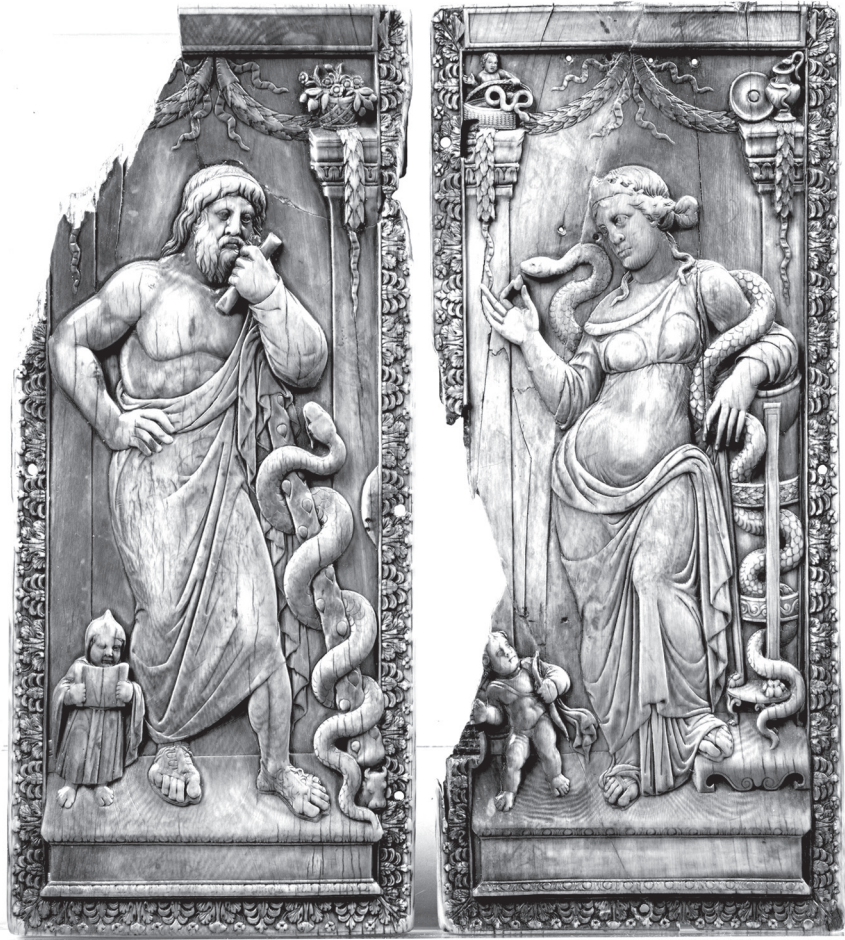
7. kép. Asklépios és Hygieia-diptychon. Róma (?) vagy Itália, 400–430, elefántcsont. National Museums Liverpool, World Museum, ltsz. M 10044

Mint szó volt róla, a diptychont készítő mester talapzatra állította, tehát szoborként jelenítette meg az isteneket, akiket a hellénisztikus korban meggyökeresedett és a római császárkor évszázadai alatt is szokásos módon ábrázolt.