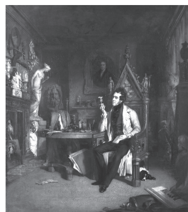
4. kép. William Daniels: Joseph Mayer , 1843, olaj, vászon. National Museums Liverpool, Walker Art Gallery, ltsz. WAG 7355