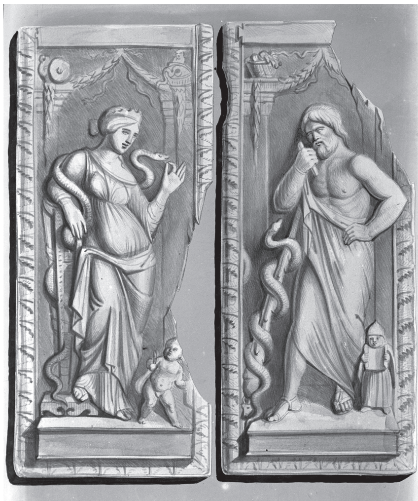
13. kép. Petrás István (?) felvétele a Liber Antiquitatis Wolfgang Böhmnek attribuált akvarelljéről: a Liber Antiquitatis 138. lapja. Üvegnegatív, 1930-as évek. Szépművészeti Múzeum, Budapest, Antik Gyűjtemény, Fényképtár, ltsz. A 4838 © Szépművészeti Múzeum

Pulszky ehhez készült jegyzetei között a „Diptychon Gaddi” címfeliratú papíríven 66 például azt olvashatjuk, hogy Caronni datálása „nehezen tartható”. (Pulszky itt nem adott saját javaslatot, mintegy két évtizeddel később még Caronniál is egy kicsit korábbra: „az Antoniusok [sic] korára” tette). 67 Már regisztrálta azt is, hogy szerepel Carl Otfried Müllernek az antikvítás tárgyi hagyatékát áttekintő, a korban mérvadónak számító kézikönyvében. Neki – a Viczay számára készült Morgen-metszet alapján – szintén nem volt kétsége a diptychon „eredetisége” felől. 68