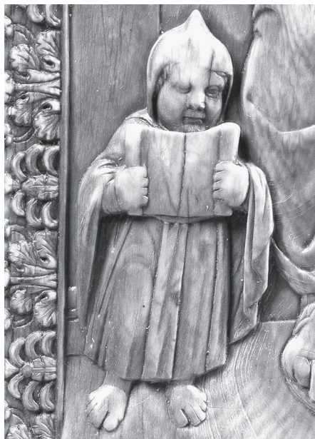
7.a kép. Asklépios és Hygieia-diptychon, részlet: Telesphoros