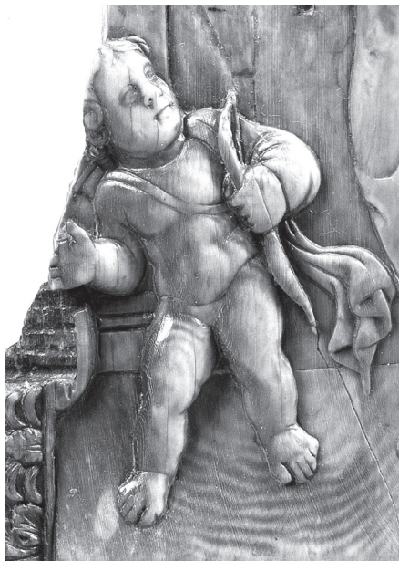
7.b kép. Asklépios és Hygieia-diptychon, részlet: Erós