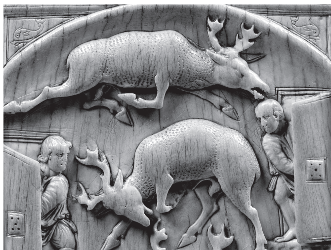
6.c kép. Vadászat-tábla, részlet: a szarvas haláltusája

Rómában készült, a gondosan előre fésült hajú, rövid szakállú férfi kora alapján a praetori hivatalba tölthette be, amelyet a kor előkelői húszas éveik elején viseltek (szemben a tizenéves korukban viselt questorság gal). 22 A diptychonok zömén a középben ábrázolt alak fogja azt a kendőt ( mappa ), amelyet a játékok kezdetét jelző az elnöklő magistratus elejtett. Itt azonban szokatlan módon a kendőt nem a középső, hanem a balján ülő férfi jobb kezében látjuk, míg a jobb oldalon helyet foglaló idősebb, rövid szakállú férfi jobb kezével a hivatalba beiktatott