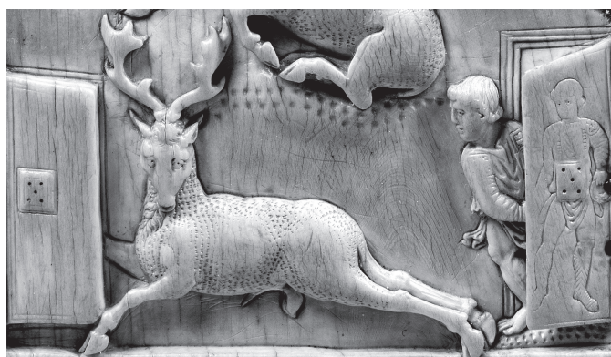
6.b kép. Vadászat-tábla, részlet: győztes vadász képe az ajtón