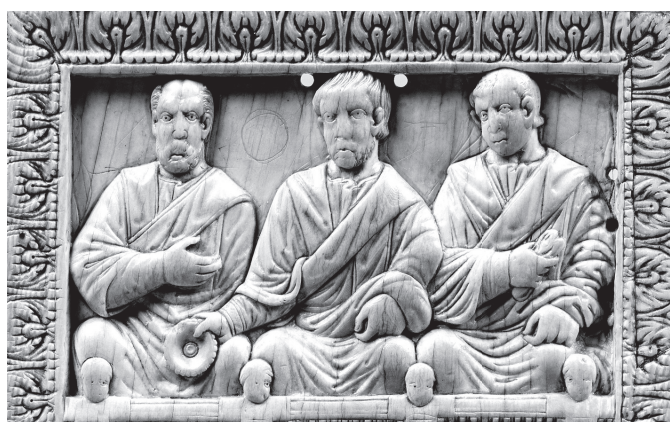
6.a kép. Vadászat-tábla, részlet: tisztségviselők a díszpályában