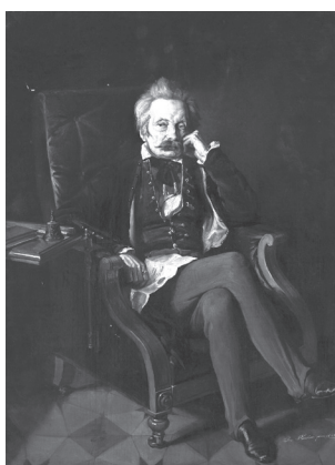
2. kép. Joseph Bucher: Fejérváry Gábor , 1843, olaj, karton. Magyar Nemzeti Múzeum, Budapest, Történelmi Képcsarnok, ltsz. 60.16