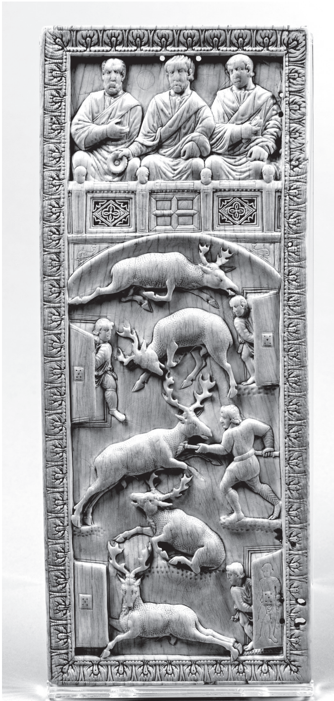
6. kép. Vadászat-tábla. Róma (?), 4. század vége – 5. század első évtizedei, elefántesont. National Museums Liverpool, World Museum, ltsz. M 10042

azok a diptychonok, amelyeket nagy valószínűséggel 396-ra keltezhetünk. Közéjük tartozik a Rufius Probianus, Róma vicarius a által hivatali beiktatása alkalmából készített sorozat, 11 illetve azok a faragványok, amelyekkel Flavius Stilicho emlékezett meg fiának, Eucheriusnak a tribunus et notarius tisztségbe történő beiktatásáról. 12 Szintén a 4. század legvégéről, valószínűleg ugyancsak 396-ból származhatnak azok a darabok is, amelyeket feltehetően a Lampadius és a Rufinus család tagjai között kötött házasság alkalmából küldtek szét. Ezek a