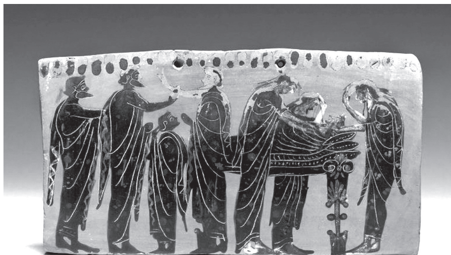
2. kép. Pinax temetési jelenettel, Gela-festő, Kr. e. 6–5. század. Walters Art Museum, Baltimore

indigna morte kifejezéssel rokon értelmű, az utóbbi pedig etimológiai kapcsolatban áll a peremptum participiummal, elvégre mindkettő az emo („elvesz”) ige egy-egy igekötős alakjának a származéka. „Méltánytalan” alatt túl korán bekövetkező halált értünk, amely jellemző szőfordulata azon római gyász-epigrammáknak, 40 amelyek fiatalon elhunytak sírfelirataként olvashatóak, vagyis a kifejezés jelenléte a vergiliusi szövegben – akár a catullusi intertextus nélkül is – annak epigrammatikus jellegéhez járul hozzá.