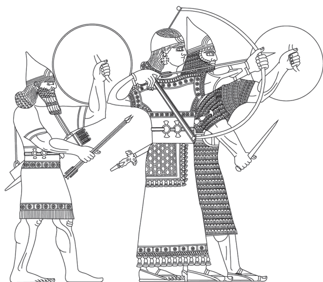
4. kép. Asszír eunuch előkelő (Dezső 2012a, 324, 125. kép nyomán)

Az eunuchok különben nem voltak túlságosan sokan, nem alkottak önálló katonai egységeket, csupán a vezető udvari és katonai beosztásokban találhatjuk meg őket.