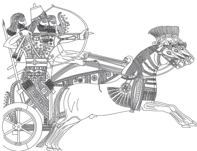
1. kép. Asszír király harci kocsiján (Dezső 2012b, 266, 23. kép nyomán)

történelméről és hadseregéről. Ezt követően ki kell térnünk az asszír gazdaság alapjaira, valamint a hadsereg és a társadalom többi részének viszonyára.