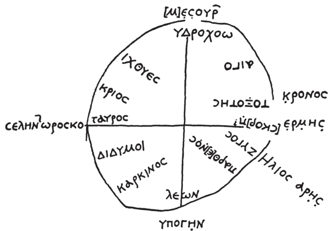
1. kép. Görög nyelvű horoszkóp, Kr. u. 15–22 körül (Neugebauer – Van Hoesen 1959, 18, 9. ábra)

tételezés az, hogy létezhetnek más bolygók és csillagok, amelyeket mi nem láthatunk, de az asztrológia alapelvei szerint ezeknek ugyanúgy hatniuk kellene a földi létezőkre, ami tudtunkon kívül befolyásolná a horoszkópból kiolvasható tulajdonságokat, eseményeket. Favorinus megemlíti még azt a problémát is, miszerint a fogantatás vagy a születés pillanatát kell-e figyelembe venni a horoszkóp felrajzolásához; 14 illetve hogy egy utód születése és így a sorsa is kiolvasható-e már a felmenői horoszkópjából, mint ahogy azoké is az ő felmenőikéből, és így tovább az összes generációra visszamenőleg.