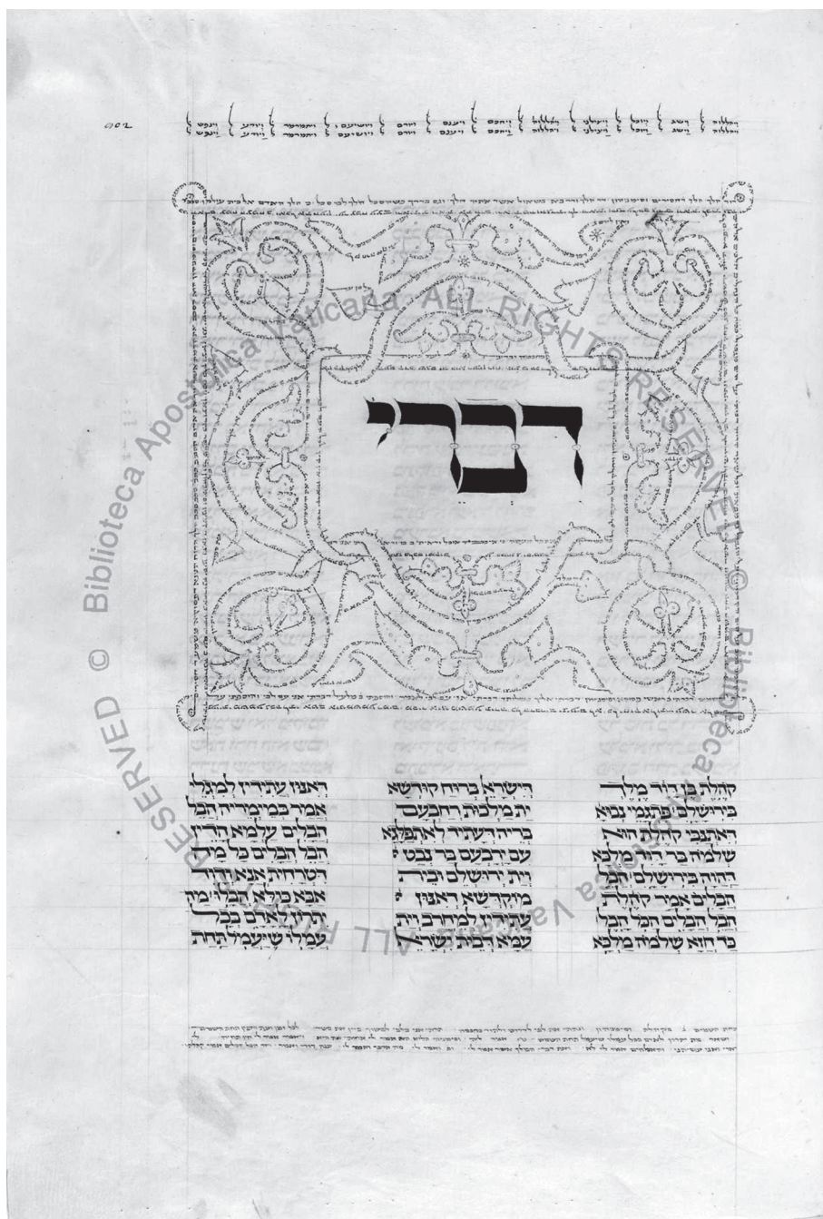
1. kép. A Qohelet Targum vatikáni kéziratának (Ms Urb. Ebr. 1) első oldala

A Qohelet felfogását tekintve egy kiszögellésnek tekinthető a Héber Bibliában. A könyv ugyanis, ahogyan többször is utaltam rá, szkeptikusan szemléli a hagyományos zsidó bölcsességet. De egyéb téren is eltér a hagyományos gondolatiságtól: saját tapasztalatából kiindulva kétségbe vonja a jutalom-büntetés elvét (7,15), mely a Példabeszédek könyvére jellemző, a bölcsesség előnyeit a balgasággal szemben (2,13–16),