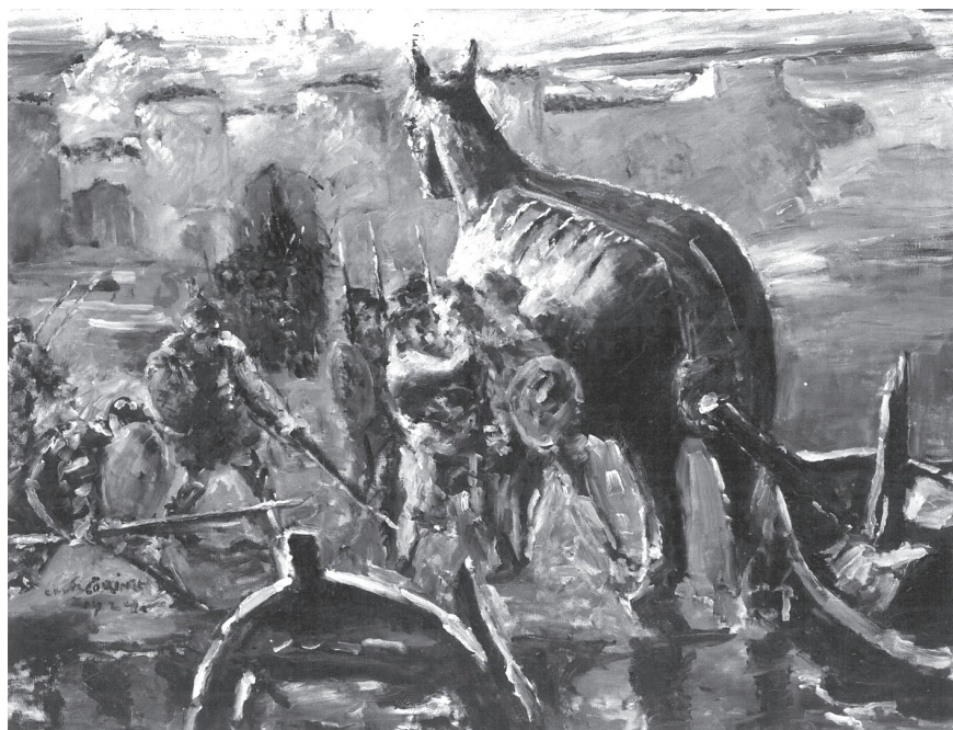
2. kép. Lovis Corinth: Das Trojanische Pferd , 1924. Staatliche Museen zu Berlin

Aeneas elköltözése után (meglehető ez a szóhasználat, mert hétköznapiasítja a Trójából való menekülés nagy toposzát) a tér hátramaradt Trójában, és a természet jelenlevőként őrzi a múlt egyes mozzanatait: az emberi kiáltások, amelyek a múltban hangzottak fel, ott lüktetnek az élettelen kövekben. Kántor átértelmezi a „part-