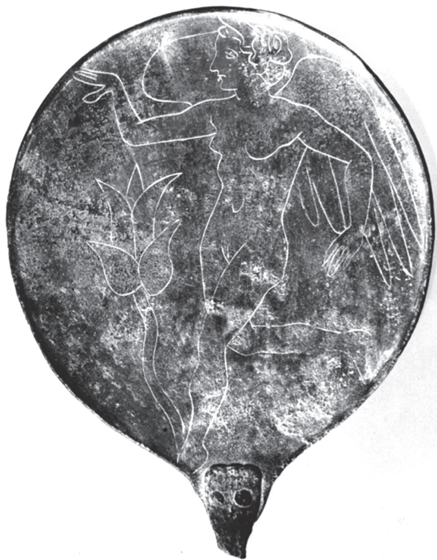
1. kép. Etruszk bronztükör „Lasával”. Kr. e. 4. század vége – 3. század közepe. Szépművészeti Múzeum, Antik Gyűjtemény

Nagy volt Hádés, s Kerberos dolga sok: jöttek, jöttek a jövevények egyre. S elfáradt már, foga se csattogott, az újakat egykedvűen terelte. 3