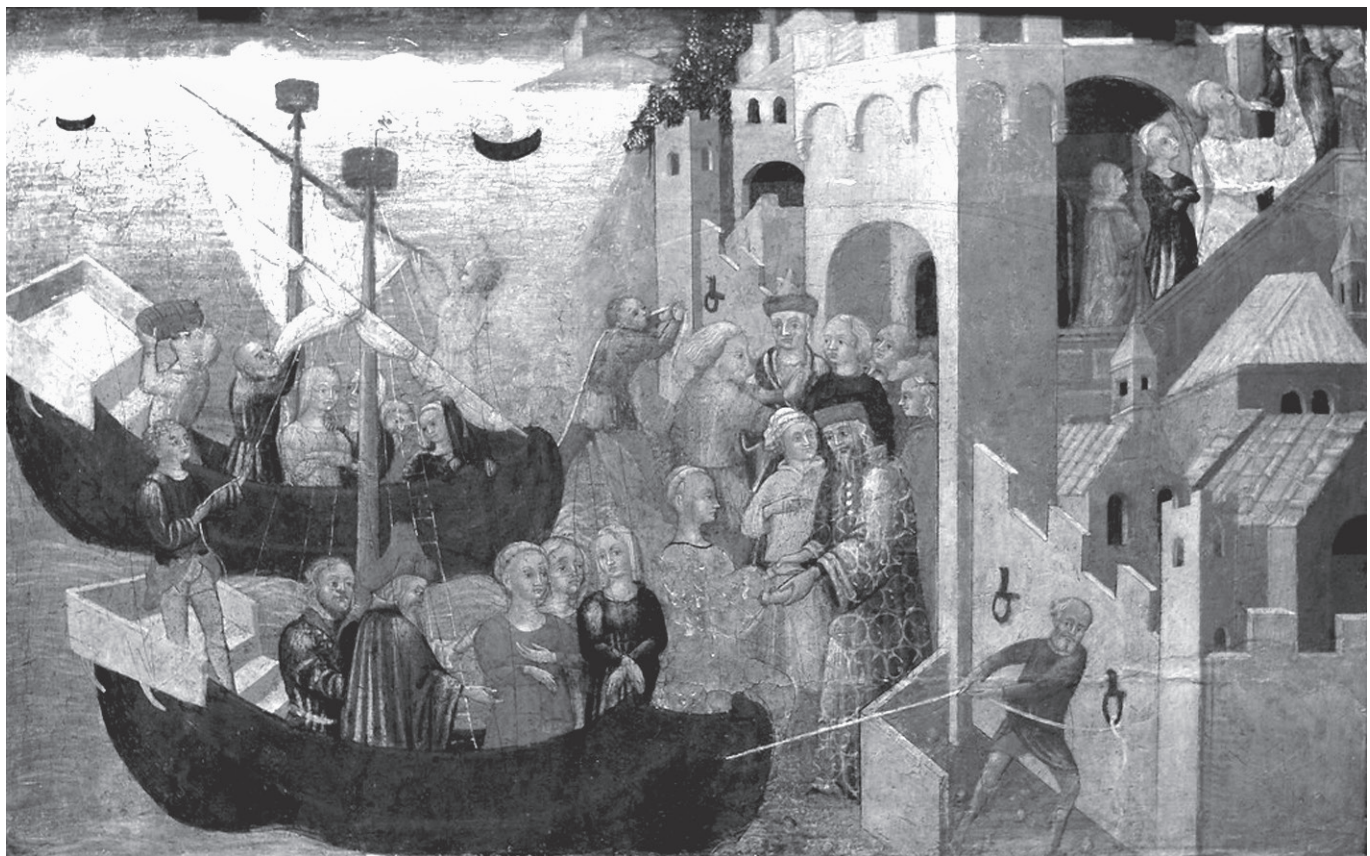
3. kép. Sienai mester: Helené megérkezése Trójába , 1430 körül. Städel Museum, Frankfurt

Ismered ezt a réges-régi drámát... Bármerre indulsz, mindig Trója vár rád: Mint délibáb ragyog a messzeségben, vagy saját ablakodból integet feléd, s hiába tiltakozol, hogy nem és nem, s hiába, ha az istenek is vigyáznak, mindenki odaadja végül mindenét – akháj a trójainak, trójai az akhájnak.