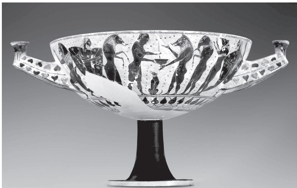
3. kép. Circe Odysseus társaival. Feketealakos kylix, archaikus kor, Kr. e. 550–525. k. Museum of Fine Arts, Boston, lt. sz. 99.518

Bármí varázs sem elég, hogy eloltsa a régi szerelmet, még kéngőz sem elég végleg elűzni Amort.