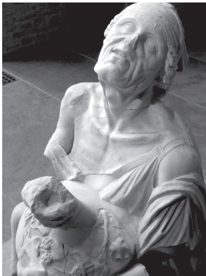
1. kép. Részeg öregasszony. Római márványmásolat, Kr. e. 200–180. Glyptothek, München, lt. sz. 437

Amores I. 1, 17–20 7 (Orbán Ottó fordítása)