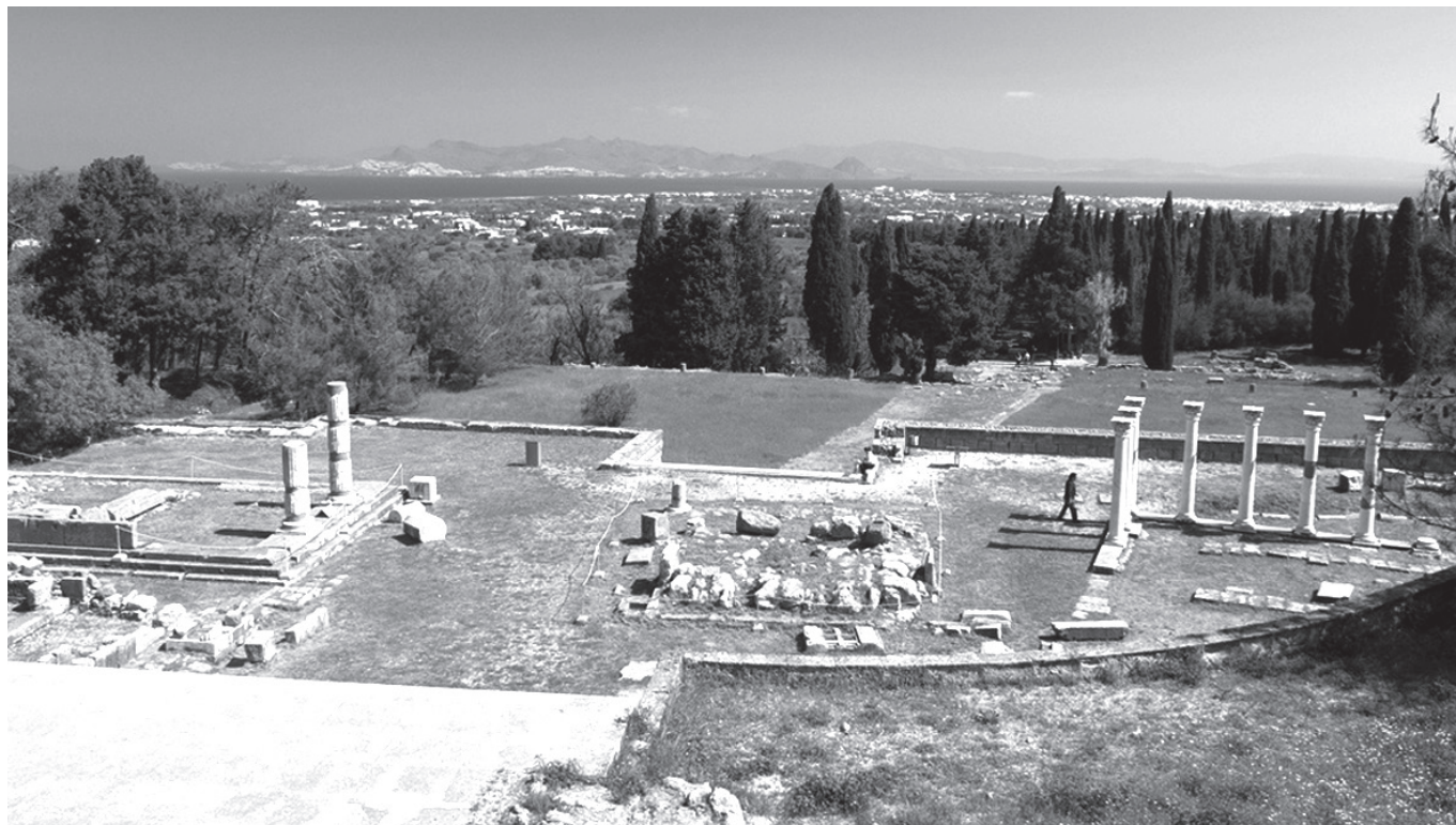
2. kép. A kósi Asklépieion maradványai

A szentélyek sérthetlensége kezdettől fogva magától értetődött a görög világban. Bár szentélyek (fosztogatás, pusztítás) és a szentélyben tartózkodó vagy oda menekülő személyek elleni erőszakra gyakran volt példa, ezek mindig kivételes esetnek számítottak, és felháborodást váltottak ki. Egyes tragédiák és történetírói művek ezenkívül arra intették az embereket, hogy a szentélyek elleni erőszakot isteni büntetés követi. A sérthetlenség vonatkozott továbbá a pánhellén ünnepekre utazókra, amelyet az ünnep idejére érvényes ünnepi béke ( ekecheiria ) biztosított. Amikor a hellénisztikus korban a görög történelem során első ízben államközi szerződésekben igyekeztek biztosítani a szentélyek sérthetlenségét, pragmatikus módon arra reagáltak, hogy a közvélemény nyomása és az isteni büntetés kilátásba helyezése nem elegendő a szentélyek és az ünnepekre utazók megvédéséhez. Egyes szerződések jogi eszközökkel szankcionálják az asylia megsértőit. A boiót városok és a delphoi Apollón-szentélyt fenntartó városok, az amphiktyonia közötti szerződések értelmében az ünnepekre