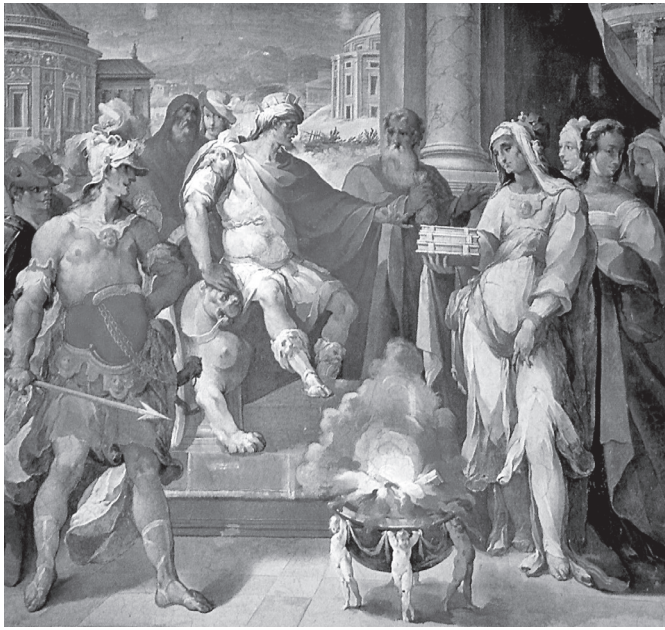
3. kép. „Miután az asszony a többi tűzbe vetette, Tarquinius Superbus három Sibylla-könyvet vásárol az eredeti áron.” Mint mindegyik képen, úgy itt is nem ókori tekercesek láthatók: a festők a kortárs könyvformátum segítségével jelenítik meg a példázatszerű antik történeteket. (A kép forrása: Piazzoni et al. 2010, 224.)