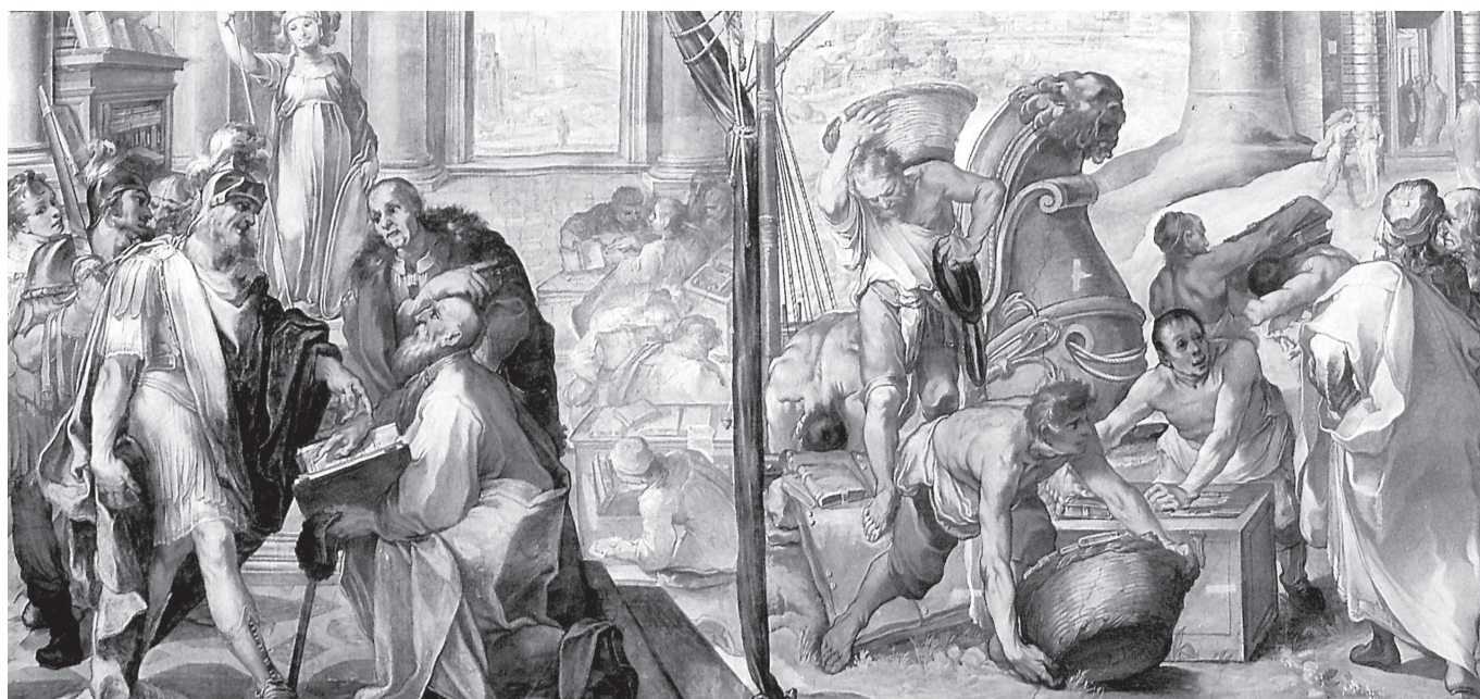
1. kép. Balra: „Görög területen először Peisistratos alapít nyilvános könyvtárat.”

V Sixtus pápa (1585–1590) a neves építész, Domenico Fontanát bízta meg, hogy tervezze meg a Vatikáni Könyvtár új épületét; az olvasótermet 1588 és 1590 között freskósorozatokkal díszítették (1–4. kép). 1 A méltán híres Sixtus-terem – közel húsz művész által készített – festményei Silvio Antoniano 2 humanista műveltségű bíboros tervei alapján készültek: az oszlopokon látható sorozat huszonnégy darabja az egyes ábécék mitikus földalálóit, így például az egyiptomi Íziszt, majd Kekropst, Kadmost, Linost és Pythagorast ábrázolja. A második freskóciklus témája az egyetemes zsinatok, míg az utolsó sorozat tárgya: de bibliothecis antiquis , „az ókori könyvtárakról.” Ószövetségi és babilóniai jelenetek után az athéni, alexandriai és római könyvtár ábrázolása következik, majd a jeruzsálemi és caesareai, illetve az apostoli és főpapi gyűjteményeket megjelenítő festményekkel zárul a sor. Athén, Alexandria és Róma városa két-két freskón szerepel. A hat kép felirata: Pisistratus primus apud Graecos publicam bibliothecam instituit („görög területen először Peisistratos alapít nyilvános könyvtárat”), Seleucus bibliothecam a Xerxe asportatam referendam curat („Seleukos parancsot ad arra, hogy a Xerxés által elrabolt könyvtárat szolgáltassák vissza”), Ptolemaeus ingenti bibliotheca instructa Hebraeorum lib-