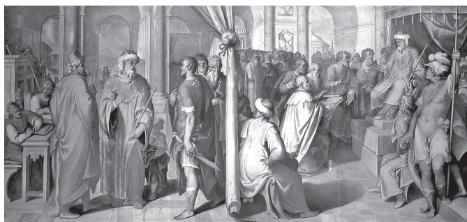
2. kép. Balra: „A nagykönyvtár létrehozása után Ptolemaios a zsidók könyveit igényli.” A kép közepén álló Ptolemaios phaléroni Démétrios felé fordul, aki az uralkodó figyelmét felhívja a zsidóság szent irataira.

Jobbra: „Eleázár hetvenkét fordítót küld, akik Ptolemaiosnak átadják a könyveket.” A trónon ülő Ptolemaios mellett katona áll, fegyverzetét V. Sixtus címerállata, oroszlánfej díszíti.