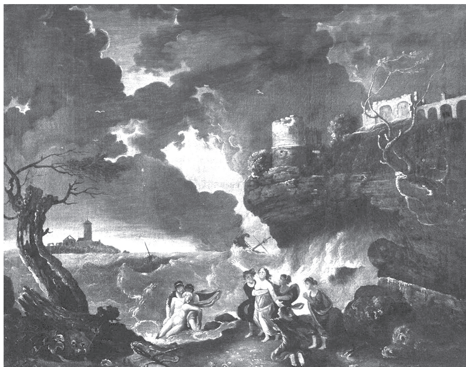
1. kép. Ceyx és Alcyone. Richard Wilson munkája, 1800 körül. Walesi Nemzeti Múzeum

valamely alakja, amely utalhat a fizikai elválásra, 13 de jelezheti a halál közeledtét is: parat ire ( Met. XI. 413); ora / pallor obit ( Met. XI. 417–418); nimumque es certus eundi ( Met. XI. 440). Alcyone és Ceyx történetének ismeretében már ez a kezdő szó meghatározza és előre jelzi az események szomorú alakulását, a tengeri vihart, a halálhírt, majd később az átváltozást. Hasonlóképpen érdekes az előre jelző párhuzamokat figyelni az ébredések mozzanataiban is; Cyparis (és a regény szinte minden szereplője) álmát egy hangforrás szakítja meg: